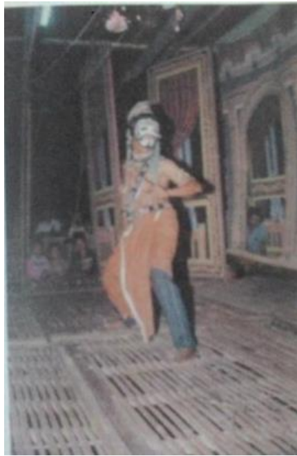
Gambar 5. Pementasan Loddrok Jata Kemala menggunakan panggung lencak tahun 1980-an

Tidak semua kelompok Loddrok di Sumenep dapat dengan cepat mengikuti perubahan teknis pertunjukan yang diterapkan kelompok Rukun Famili. Beberapa kelompok di daerah pesisir utara masih menggunakan teknis panggung yang masih sederhana, seperti kelompok Jata Kemala yang masih menggunakan panggung lencak di tahun 1980-an (gambar 6). Serta penggunaan box lampu pada kelompok Rukun Kemala yang masih digunakan seperti (gambar 5). Perubahan-perubahan teknis pertunjukan juga harus dibarengi dengan kondisi keuangan dari kelompok Loddrok itu sendiri.