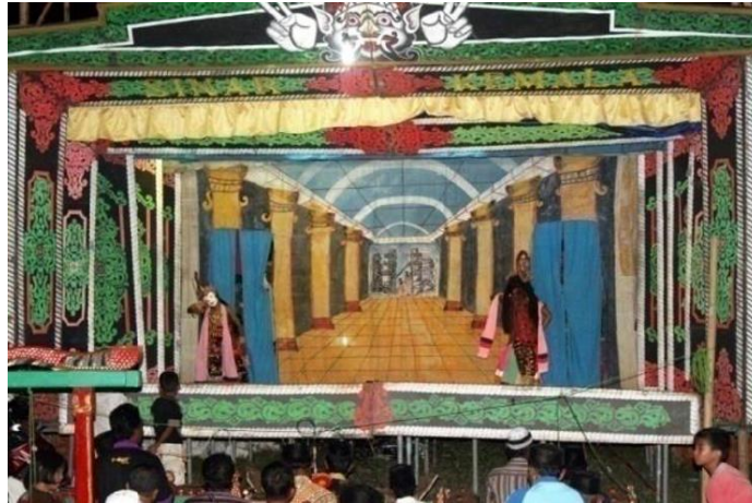
Gambar 6. Ornamen kepala kala dan nama Sinar Kemala di bawahnya, serta efek nagelima pada panggung Topeng Dhalang