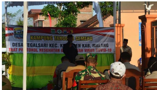
Gambar 9. Bupati Meresmikan Kampung Tangguh Semeru

Bupati yang hadir saat peresmian berharap program Kampung Tangguh Semeru ini memberikan dampak positif bagi masyarakat dalam menjalankan kehidupan sehari-hari ditengah era new normal ini (Fasha, 2020). masyarakat harus menjalankan protokol kesehatan sesuai anjuran, selalu menggunakan masker saat berpergian, rajin mencuci tangan, dan terus menjaga kesehatan agar Desa Tegalsari terbebas dari virus covid-19.