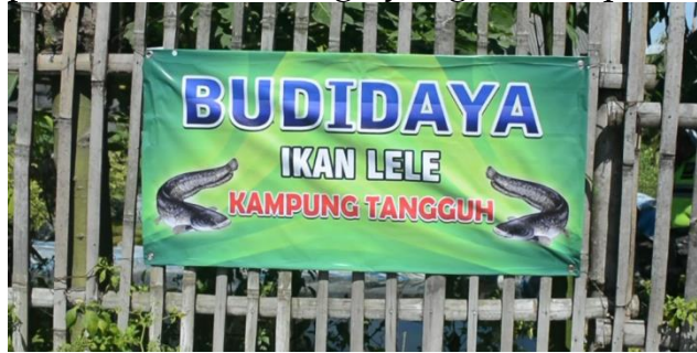
Gambar 7. Budidaya Ikan Lele Desa Tegalsari

Tegalsari yaitu, budidaya ikan lele dan produksi krupuk. Hal tersebut bertujuan untuk mengontrol, memantau, serta memastikan kesiapan desa menghadapi dampak perekonomian (Rohmah & Syari, 2020). Beberapa produksi rumahan yang ada di Desa Tegalsari ini diharapkan bisa membantu perekonomian warga yang terdampak.