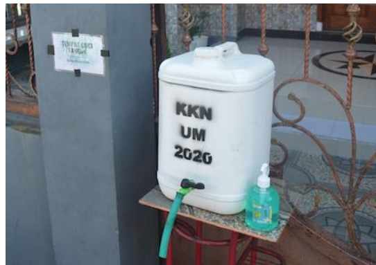
Gambar 4. Pengadaan Tempat Cuci Tangan dan Juga Handsanitizer

Selain masker, juga dilakukan kegiatan pengadaan tempat cuci tangan dan juga handsanitizer. Nantinya bahan dan barang sanitasi ini akan disebar di beberapa titik desa untuk memfasilitasi warga yang beraktivitas sehari-hari untuk menumbuhkan tradisi rajin mencuci tangan. Pada kegiatan pengabdian masyarakat ini diberikan 5 tempat cuci tangan lengkap dengan sabun dan handsanitizer . Tempat cuci tangan ini memiliki kekurangan yaitu pendistribusian air ketika air dalam bak tersebut habis, namun kelebihanannya tempat ini ringan serta mudah untuk dipindahkan.