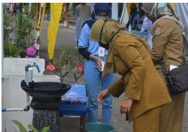
Gambar 6. Melakukan Cuci Tangan dengan Sabun

Selama acara peresmian Kampung Tangguh Semeru, Bupati mengunjungi beberapa tempat yang menjadi pusat ekonomi di Desa