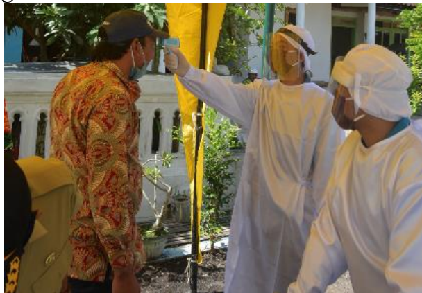
Gambar 5. Pengecekan Suhu Tubuh

Kegiatan dilaksanakan sesuai dengan protokol kesehatan yang sudah ditentukan yaitu dengan menerapkan Physical distancing . Perubahan perilaku masyarakat yang diakibatkan oleh penerapan kebijakan physical distancing dan social distancing merupakan cara terbaik yang dapat dilakukan untuk menghambat penyebaran dan penularan virus Covid-19 ditengah masyarakat (Kresna, A & Ahyar, J, 2020). Semua orang mendapatkan pengecekan suhu tubuh menggunakan thermo gun, mencuci tangan sebelum memasuki area kegiatan, menggunakan handsanitizer , menjaga jarak minimal 1 meter, dan wajib menggunakan masker.