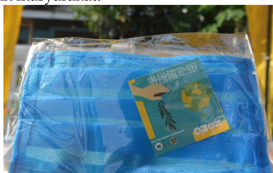
Gambar 2. Paket Masker

Untuk upaya mendukung program Kampung Tangguh Semeru ini, juga dilengkap dengan kegiatan pengabdian masyarakat memberikan kontribusi berupa pengadaan 1000 masker , tempat cuci tangan, dan handsanitizer . Masker yang kami pilih untuk dibagikan memiliki kelebihan yaitu waterproof . Masker waterproof sangat membantu menekan penyebaran virus covid-19, dikarenakan masker tersebut dapat meminimalisir penularan virus covid-19 melalui droplet saat kita berbicara atau bertemu dengan orang lain (Buana, 2017). Meskipun kita sudah menggunakan masker, kita harus tetap menjaga jarak karena masker bukanlah satu-satunya. Setelah kita menentukan jenis masker yang akan kita pilih, langkah selanjutnya adalah survey harga kemudian dilanjutkan dengan pembelian dan pengemasan masker sebelum nantinya akan disalurkan kepada masyarakat. Pengemasan masker ini kita memberi plastik disetiap maskernya dan juga sticker kegiatan pengabdian masyarakat agar lebih steril dan juga sebagai identitas kegiatan pengabdian masyarakat yang nantinya juga akan mempermudah dalam distribusi kepada masyarakat. Pengemasan masker ini dalam 1 plastik terdiri dari 1 masker dan juga 1 sticker kegiatan pengabdian masyarakat.