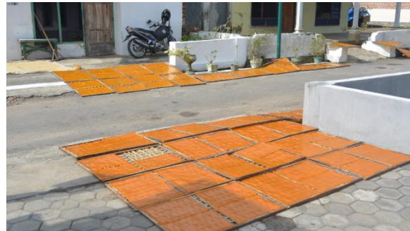
Gambar 8. Home Industri Kerupuk