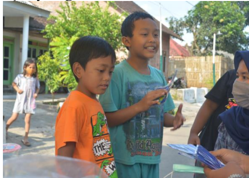
Gambar 3. Membagikan Masker pada Masyarakat

masyarakat akan lebih mematuhi protokol kesehatan dan bermasker menjadi hal yang wajib yang dibutuhkan bukan karena paksaan.