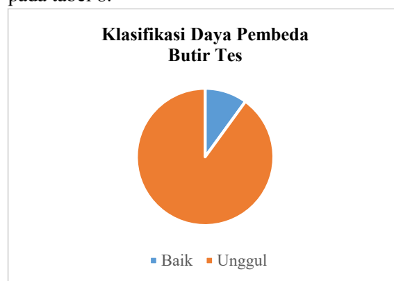
Gambar 2 Grafik Hasil Analisis Daya Pembeda Butir Tes

Namun, apabila nilai signifikansinya sudah memenuhi syarat, yaitu kurang dari 0,05 tetapi pearson correlation bernilai negatif, maka butir soal dikatakan tidak valid. Terlebih lagi jika nilai signifikansi yang didapat lebih dari 0,05 maka, butir tes dinyatakan tidak valid. Uji korelasi product moment Pearson menunjukkan hasil pada tabel 8.