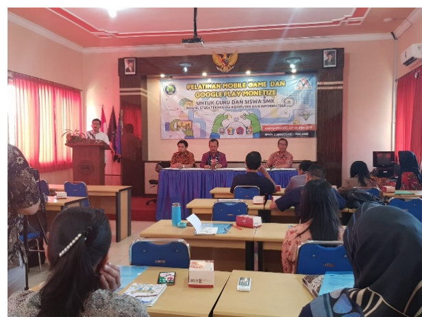
Gambar 1. Kegiatan Seminar