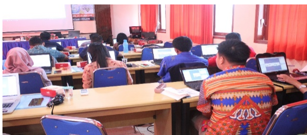
Gambar 3. Kegiatan Penugasan