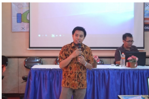
Gambar 2. Kegiatan Workshop