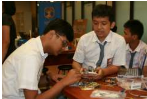
Gambar 3. Contoh Gambar dengan Resolusi Cukup