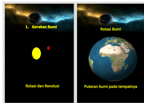
Gambar 2: gambar Hasil Desain Tampilan Judul