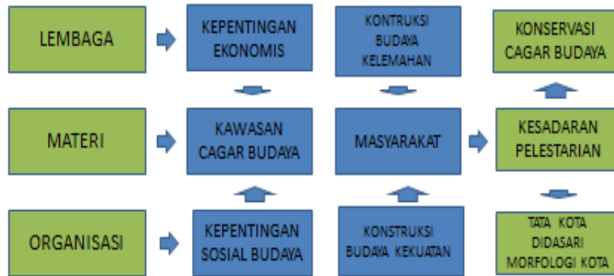
Gambar 2. Model Pengembangan Bahan Ajar Sejarah Lokal Kota Kudus

lembaga non pemerintah yang berkepentingan terhadap peninggalan-peninggalan budaya. Ketiga indikator tersebut sangat menentukan keberadaan cagar budaya. Kehadiran ketiga lembaga tersebut akan mampu menekan kepentingan-kepentingan ekonomi yang cenderung merusak budaya dan menumbuhkan motivasi pada masyarakat untuk menghayati nilai-nilai sosial budaya. Peran ketiga indikator tersebut pada akhirnya mengarahkan pada konstruksi berpikir masyarakat terhadap peninggalan-peninggalan budaya secara positif, akibat dari sosialisasi yang dilakukan secara transmisi budaya melalui sekolah terciptalah kawasan cagar budaya dan tata kota sesuai dengan morfologi kota. Secara garis besar Model Pengembangan Bahan Ajar Sejarah Lokal Kota Kudus digambarkan sebagai berikut: