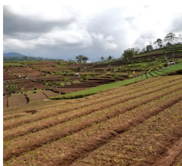
Gambar 2. Lahan tegalan warga Dusun Tokol yang ditanami bawang merah

Dikarenakan memiliki bobot dan ukuran lebih besar dan berat serta aroma yang lebih pekat maka bawang merah varietas batu ijo lebih dipilih oleh petani. Selain itu bawang merah varietas batu ijo memiliki ketahanan yang lebih tinggi dari cuaca berkabut dan hujan. Bawang merah sejatinya sangat peka terhadap curah hujan cukup tinggi (Sumarni dan Hidayat, 2005: 2). Tingginya curah hujan juga memengaruhi kualitas bawang merah. Hujan yang cukup banyak dapat memengaruhi kesehatan dan bobot bawang merah. Bawang merah sangatlah menyukai cuaca yang cerah dan sinar matahari cukup apabila ditanam di lahan persawahan. Namun bawang merah sangatlah membutuhkan cukup air. Berbeda dengan di lahan tegalan, bawang merah justru membutuhkan banyak air hujan untuk kesehatan dan kelangsungan hidupnya.