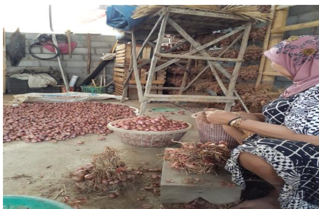
Gambar 3. Buruh perempuan sedang melakukan pritis

Setelah itu bawang merah yang sudah selesai dipritis dimasukkan ke dalam karung untuk dibawa ke lahan tegalan maupun sawah. Pekerjaan buruh perempuan selanjutnya ialah melakukan penanaman atau kegiatan tanam ini disebut oleh masyarakat dengan istilah ulur . Disebut ulur karena yang ditanam berbentuk biji, biasanya berlaku untuk tanam bawang merah. Apabila tanaman yang ditanam masih hidup dan berupa tanaman, maka masyarakat menyebutnya dengan ponjo . Pekerjaan di lahan pertanian biasanya dimulai dari pukul 7 pagi hingga berkumandangnya adzan Solat dhuhur, karena mayoritas bahkan 99% petani maupun buruh memeluk agama Islam. Pekerjaan di tegalan maupun sawah tidak pernah dilakukan secara ndino karena hal tersebut dapat memberikan tekanan kepada buruh. (Wawancara Ibu Suntianah). Apabila pekerjaan belum selesai maka akan dilanjutkan pada esok hari.