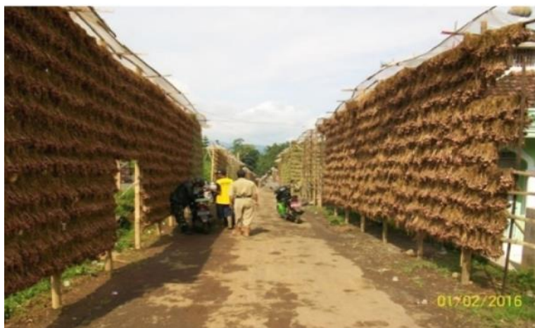
Gambar 5. Sigiran berjajar pada masa panen

Bawang merah harus dijemur di sigiran di bawah terik matahari dalam rentang waktu dua minggu untuk mengeringkan daun dan umbi bawang merah. Hal ini dilakukan agar bawang merah tidak membusuk. Setelah umbi dan daun bawang merah kering maka bawang merah akan diturunkan dari sigiran. Petani akan memanggil buruh perempuan mereka dan untuk menurunkan bawang merah dan mengikat kembali bawang merah yang sudah kering. Saat diikat ulang jumlah bawang merah sebanyak empat unting diikat menjadi satu untuk menghemat tempat. Kegiatan ini disebut dengan ngembal. Biasanya kegiatan ngembal dilakukan di gudang petani. Setelah selesai maka bawang merah disimpan di gudang dan diletakkan di sigiran dengan ukuran lebih kecil untuk selanjutnya dijual atau ditanam lagi di lahan pertanian.