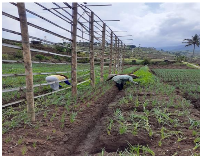
Gambar 4. Buruh Tani perempuan sedang melakukan matun

Kegiatan mencabut rumput liar ini oleh masyarakat disebut dengan matun . Selain itu petani pemilik lahan memiliki kewajiban dalam memperlakukan buruhnya ketika sedang bekerja. Kewajiban tersebut ialah memberi waktu istirahat dan bekal makanan ketika waktu jam makan tiba. Pada umumnya waktu istirahat makan diberikan pada pukul 8 sampai setengah 9 pagi. Selain itu kewajiban petani kepada buruh perempuannya ialah memberikan upah tepat waktu dan memberikan upah ketika sangat dibutuhkan. Upah yang diberikan pada waktu itu umumnya berkisar Rp.5000,- sampai Rp. 7.000,- dengan waktu jam kerja dari pukul 7 pagi hingga adzan dhuhur berkumandang. Namun seiring bertambahnya tahun jumlahnya bisa meningkat. Pada akhir tahun 1999 upah buruh tani Perempuan mencapai Rp. 10.000,-.