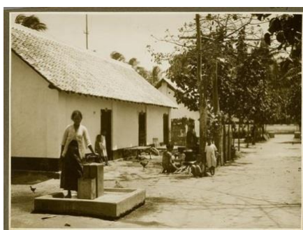
Gambar 3. Perkampungan di area Pabrik Meritjan

Metode, cara, dan ilmu yang secara tidak langsung masuk melalui tangan-tangan pelaku kolonialisme dapat dimanfaatkan oleh masyarakat sehingga para petani mampu mengetahui metode tanam baru yang lebih menguntungkan serta para pekerja pabrik mengetahui sistem ketenagakerjaan sederhana. Peran antara perkebunan tebu dan pabrik gula dan pekerja dalam hal ini adalah masyarakat pribumi saling berkaitan dan mempengaruhi. Adanya depresi ekonomi pada akhir tahun 1929 yang mengalami naik turun sampai tahun 1931 juga mempengaruhi berkurangnya luas perkebunan serta jumlah tenaga kerja. Hal tersebut tentunya juga mempengaruhi kehidupan sosial ekonomi masyarakat dimana masyarakat banyak yang kehilangan pekerjaan pada masa-masa tersebut dan menimbulkan pengangguran. Meskipun umumnya para pekerja pabrik dan petani gula yang bersifat musiman tersebut terkadang juga berpindah-pindah pekerjaan. Namun, Pabrik Gula Meritjan di Kediri ini bias dikatakan memiliki implikasi yang besar terhadap kehidupan sosial masyarakat.