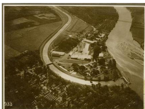
Gambar 1. Areal PG Meritjan dekat dengan Sungai Brantas, Kediri

Daerah Jawa Timur merupakan daerah yang memiliki topografi dan iklim sesuai untuk perkebunan tebu. Perkebunan tebu sebagai bahan baku pembuatan gula pada umumnya lebih sesuai dengan topografi berupa sawah dan tegal. Di daerah Kerasidenan Kediri sendiri memiliki tanah jenis alluvial yang subur dengan topografi yang sesuai. Kerasidenan Kediri terletak di ketinggian rata-rata 67 mdpl dengan tingkat kemiringan 0-40%. Dengan ketinggian tersebut, apabila di komparasikan dengan Teori Iklim Junghuhn, daerah dengan ketinggian 67 mdpl sesuai untuk vegetasi tebu. Kerasidenan Kediri dialiri oleh sungai terbesar di Jawa Timur yakni Sungai Brantas. Pabrik Gula Meritjan sendiri terletak dekat dengan Sungai Brantas tersebut. Menurut arsip buku tahunan produsen gula di Jawa tahun 1911 atau Jaarboek voor Suikerfabrikanten op Java Jargaang 1911 , pabrik ini berdiri pada tahun 1883. Tepatnya di Jalan Merbabu, Kelurahan Mrican, Kecamatan Mojoroto, Kediri, Jawa Timur.