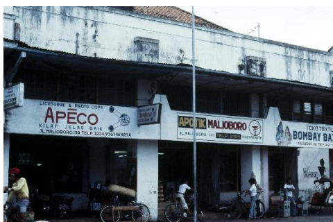
Gambar 1. Suasana sepanjang jalan Malioboro tahun 1975

Terbentuknya forum diskusi itu juga tidak terlepas dari seringnya, atau istilah lain menyebutkan “intensitas” dalam perjumpaan di jalanan Malioboro. Selain karena intensitas semaraknya forum diskusi, terbentuknya PSK ini juga dipengaruhi dengan adanya beberapa kantor penerbitan surat kabar (koran) yang ada di Malioboro, diantaranya ialah Publica , Pelopor Yogya dan Harian Kedaulatan Rakyat . Dengan demikian, melalui hal ini dapat dibayangkan bahwa bagaimana nuansa semarak gairah diskusi pada saat itu dapat terbentuk.