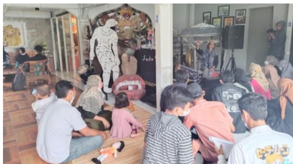
Gambar 5. Kegiatan Berdiskusi Wayang Sukuraga