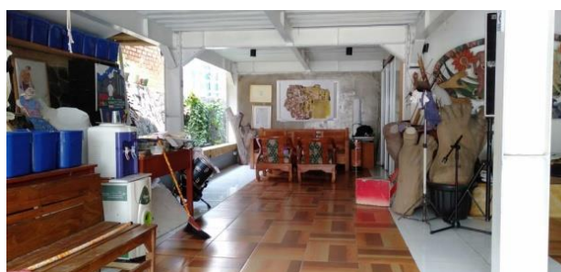
Gambar 3. Ruang Workshop dan Pertunjukan