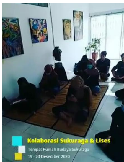
Gambar 7. Kolaborasi Sukuraga dan Lises