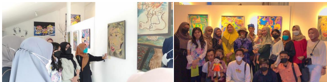
Gambar 8. Kunjungan Mahasiswa PMM 2021 ke Rumah Budaya Sukuraga