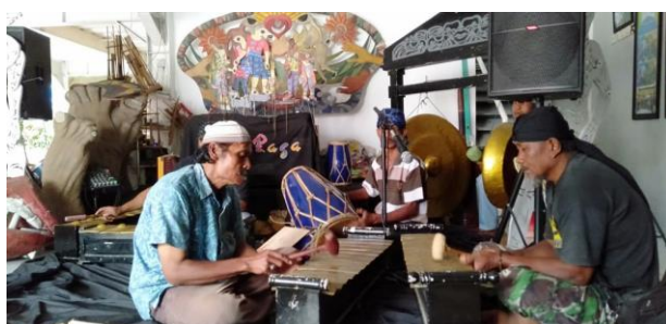
Gambar 6. Pertunjukan Wayang Sukuraga Sukuraga

Rumah Budaya Sukuraga juga sebagai tempat untuk menampung berbagai komunitas, seperti komunitas budaya, ekonomi, dan lain sebagainya. Biasanya, komunitas-komunitas memanfaatkan Rumah Budaya Sukuraga sebagai wadah untuk berdiskusi, menonton film, dan juga pembuatan konten. Pada awalnya memang tujuan mereka untuk membuat konten, akan tetapi pada akhirnya secara tidak langsung mereka mendapat pemahaman tentang Wayang Sukuraga. Oleh karena itu, Rumah Budaya sangat berperan dalam mengenalkan dan memberikan pemahaman terhadap pesan-pesan moral yang terkandung dalam Wayang Sukuraga (Effendi, 2021).