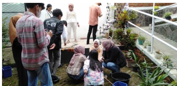
Gambar 4. Kegiatan Workshop Membuat Wayang Sukuraga oleh Peserta Pertukaran Mahasiswa Merdeka Tahun 2021

Rangkaian kegiatan yang dilakukan di Rumah Budaya Sukuraga pada umumnya pengunjung terlebih dahulu akan diajak ke ruang Galeri Sukuraga yang berada di lantai atas. Tujuannya adalah agar para pengunjung dapat memahami terlebih dahulu asal-usul Wayang Sukuraga dan perkembangannya (Effendi, 2021). Selanjutnya, pengunjung akan diajak untuk berdiskusi perihal Wayang Sukuraga dan semua hal yang terkait dengan wayang tersebut (Lihat Gambar 5). Selanjutnya adalah workshop. Setelah workshop, barulah kemudian pengunjung akan melihat pementasan Wayang Sukuraga yang didalangi oleh Effendi (Lihat Gambar 6).