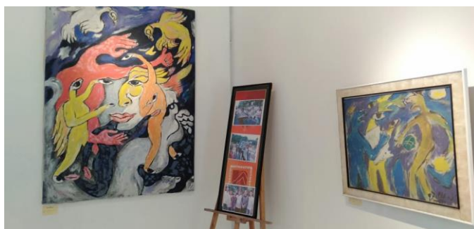
Gambar 2. Galeri Fendi Sukuraga

Sebagai rumah budaya, Rumah Budaya Sukuraga ini memiliki beberapa ruangan yang dapat digunakan untuk memperkenalkan dan memberikan pemahaman pada masyarakat mengenai Wayang Sukuraga. Pada lantai atas terdapat ruangan yang bernama “Galeri Fendi Sukuraga” (Lihat Gambar 2). Ruangan ini berisi lukisan karya seni rupa yang berfungsi untuk memberikan informasi terkait proses lahirnya Wayang Sukuraga. Kemudian di lantai bawah, terdapat ruang workshop dan ruang pertunjukan (Lihat Gambar 3). Ruangan workshop digunakan untuk kegiatan-kegiatan yang berkaitan dengan kesenian Wayang Sukuraga seperti membatik dan membuat Wayang Sukuraga. Sedangkan ruang pertunjukan sesuai dengan namanya difungsikan sebagai tempat pertunjukan Wayang Sukuraga.