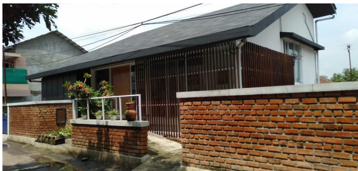
Gambar 1. Rumah Budaya Sukuraga

awalnya merupakan galeri dan Sanggar Sukuraga. Namun, setelah dikaji lebih dalam, kemudian pada tahun 2016 barulah dibuat Rumah Budaya Fendi Sukuraga, yang kegiatannya adalah untuk memperkenalkan Wayang Sukuraga dan untuk menyampaikan pendidikan karakter melalui pendekatan budaya anggota tubuh dalam Wayang Sukuraga (Effendi, 2021).