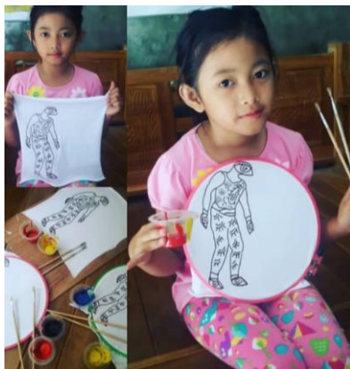
Gambar 4. Kegiatan Workshop Mewarnai Wayang Sukuraga

mewarnai Wayang Sukuraga (Lihat Gambar 4). Sedangkan untuk mereka yang sudah dewasa, kegiatan workshop yang disediakan Rumah Budaya Sukuraga adalah membuat bertematik Wayang Sukuraga (Lihat Gambar 5). Kesemuanya itu merupakan usaha Rumah Budaya untuk memperkenalkan dan melestarikan kesenian Wayang Sukuraga.