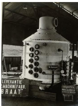
Gambar 2. Mesin Pabrik Gula Tanggulangin Tahun 1916

Pada akhir abad ke-19, Oei Tiong Ham membeli pabrik gula di Jawa, seperti Pabrik Gula Rejoagung, Tanggulangin, Kretet, dan Ponen (Ling, 2013). Pada tahun 1896, Oei Tiong Ham membeli Pabrik Gula Tanggulangin. Pembelian tersebut ini didasari karena Pabrik Gula Tanggulangin yang pernah hampir gulung tikar karena terkena dampak dari depresi gula di Eropa pada tahun 1884. Akhirnya, Oei Tiong Ham mengambil alih dan memperbaiki mesin-mesinnya ( Dagblad van Zuidholland En's Gravenhage , 1896; Setiono, 2002). Mesin-mesin tersebut berfungsi untuk melancarkan usaha gulanya, mesin baru Pabrik Gula Tanggulangin tersebut didatangkan dari Jerman ( Het nieuws van den dag voor Nederlandsch-Indië , 1910; Setiono, 2002) (lihat gambar 3).