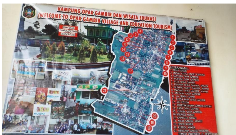
Gambar 3. Denah kampung wisata dan daftar anggota “KOG”