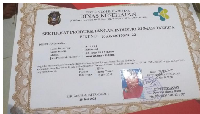
Gambar 2. Sertifikat produksi pangan industri rumah tangga Moedah Opak Gambir

Tahun 2010 diambil sebagai masa awal periodisasi atas dasar pada tahun tersebut merupakan tahun pendirian UD Moedah yang merupakan usaha pertama yang memiliki cara pengelolaan unit dagang berbeda dari usaha-usaha yang berdiri pada tahun-tahun sebelumnya, sehingga tahun pendiriannya dijadikan batas awal periode baru dalam pembabakan perkembangan sentra industri opak gambir dalam penelitian ini.