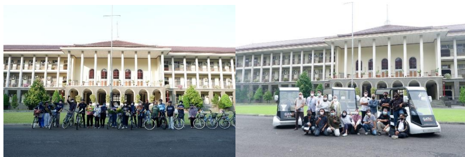
Gambar 2. Tur Warisan Budaya UGM, dengan sepeda (a) dengan mobil listrik (b)

hingga September 2023 kunjungan sudah mencapai 79.000 orang dari kalangan pelajar. Jumlah ini belum termasuk kunjungan berbagai kalangan masyarakat umum. Banyaknya kunjungan wisata atau study tour ke kampus menunjukkan pentingnya pengembangan sebuah konsep wisata berkelanjutan di lingkungan kampus UGM yang selaras dengan nilai-nilai keberlanjutan lingkungan yang juga digalakkan oleh UGM sehingga jumlah kunjungan wisata yang besar di UGM tidak meninggalkan berbagai permasalahan seperti contoh permasalahan sampah.