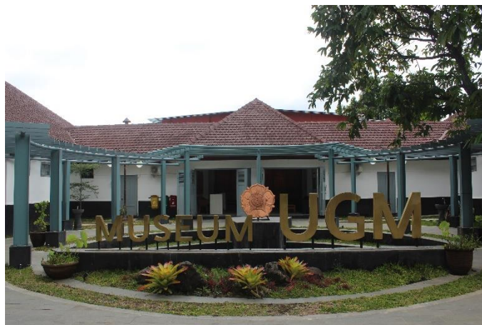
Gambar 1. Tampak Depan Bangunan Museum UGM