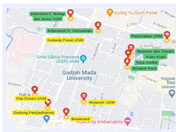
Gambar 4. Denah sebaran destinasi tur berkelanjutan