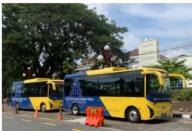
Gambar 3. Bus Trans Gajah Mada UGM

Pengembangan Destinasi Wisata dilakukan dengan melihat berbagai potensi lingkungan kampus UGM sebagai tempat wisata dan adanya muatan edukasi mengenai konsep lingkungan berkelanjutan. Beberapa lokasi yang dapat dikembangkan sebagai destinasi tur berkelanjutan di lingkungan kampus UGM di antaranya: