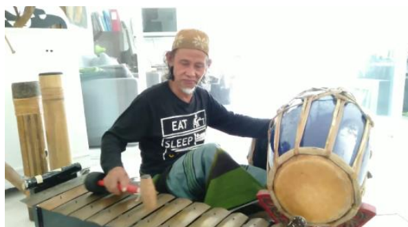
Gambar 1. Effendi masa kini

tersebut hingga kini selain difungsikan sebagai tempat tinggal juga difungsikan sebagai Rumah Budaya Sukuraga (Meidiawati, 2023).