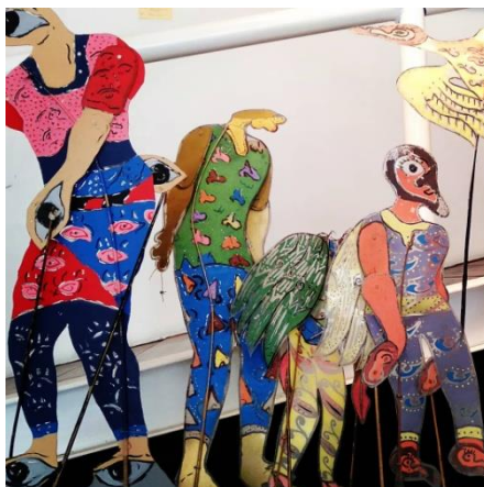
Gambar 9. Wayang Sukuraga