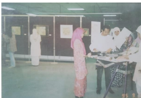
Gambar 7. Pameran Sanggar Emas Berwarna di ITM tahun 1995