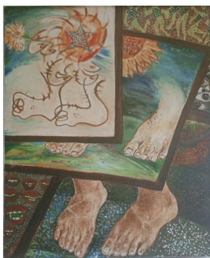
Gambar 5. Lukisan “Langkah”

Setelah lulus dari SSRI, Effendi tidak langsung kembali ke Sukabumi. Effendi masih menetap di Yogyakarta. Saat usianya 27 tahun, Effendi dibuat galau oleh kritikan kakeknya yang tinggal di Jakarta karena Effendi sering melukis manusia. Menurut sang kakek, jika melukis manusia utuh nanti dapat meminta nyawa. Kegagalan Effendi akhirnya sirna ketika dia mendapat ide untuk mengekspresikan bentuk anggota tubuh yang membantu manusia dalam perjalanan dan perjuangannya ke kanvas. Pada tahun 1985-1989 Effendi mulai melukis potongan-potongan tubuh manusia seperti tangan, mata, kaki, telinga, dan mulut yang terpisah dibatasi oleh layer-layer (Sukuraga.com, 2022). Pada tahun 1987 Effendi menemukan embrio Sukuraga dari seni yang bertema “Langkah” dengan lukisan potongan tubuh. Lukisannya tersebut masuk seleksi untuk pameran bersama pelukis muda Yogyakarta (Lihat Gambar 5).