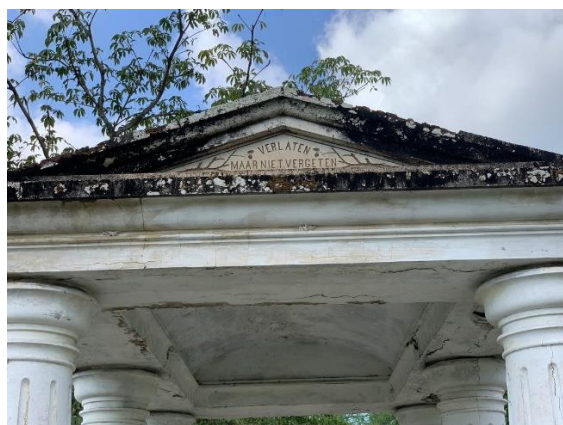
Gambar 5. Tulisan di atap belakang