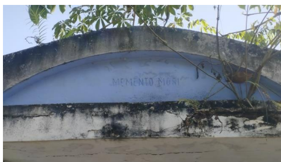
Gambar 1. Tulisan " MEMENTO MORI " pada gerbang depan.

epitaf yang direbahkan sejajar dengan permukaan tanah; kedua, epitaf yang diletakkan pada struktur bangunan lain dan dibuat dari bata perekat; dan ketiga epitaf yang diletakkan di bawah struktur bangunan lain berupa mausoleum. Berdasarkan pada pendapat Rea tersebut, dapat disimpulkan bahwa bentuk bangunan dari Mausoleum Djamijah merupakan jenis bentuk yang ketiga. Hal ini dibuktikan dengan bangunan Mausoleum Djamijah berdiri megah berbentuk kuil dengan gaya arsitektur Eropa. Pada halaman depan yang menghadap arah Selatan terdapat pintu gerbang dengan tulisan di atasnya dalam bahasa latin berbunyi, " MEMENTO MORI " yang berarti 'Ingatlah akan Kematian'.