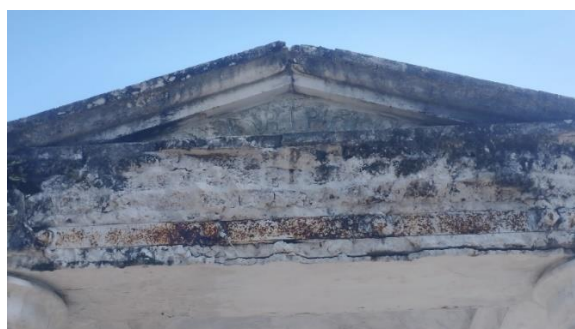
Gambar 4. Tulisan "RIP" pada atap depan

Pada masing-masing pilar terdapat gambar alat musik berupa Harpa di bawahnya. Alat musik harpa dapat diartikan sebagai tangga untuk menuju alam sesudah kematian (Suratminto, 2023). Pada depan atap kuil terdapat tulisan latin, "RIP" atau " Requiesce in Pace " yang berarti 'Beristirahat dengan Tenang'. Pada belakang atap kuil terdapat tulisan bahasa Belanda, " VERLATEN MAAR NIET VERGETEN " yang berarti 'Ditinggalkan tetapi tidak Dilupakan'. Pada bagian bawah epitaf terdapat seperti lambing heraldik, namun lambang tersebut sudah tidak bisa diidentifikasi lagi.