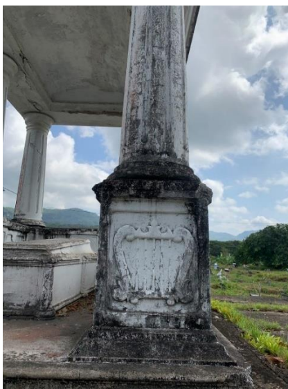
Gambar 3. Simbol Harpa di bawah Pilar Dorian

Mausoleum ini ditopang oleh enam pilar besar bergaya arsitektur Dorik atau Dorian. Pilar tersebut dapat diartikan sebagai hubungan antara dunia fana dan alam baka atau juga bisa diartikan sebagai penghubung bumi dan langit (Suratminto, 2023). Sedangkan, pilar dorik yang berkembang di pusat kota dan daratan Yunani Barat pada sekitar tahun 600 SM melambangkan kesan pemiliknya yang tegas dan berwibawa. Pilar dorik memiliki ciri ornamen polos dan sederhana.