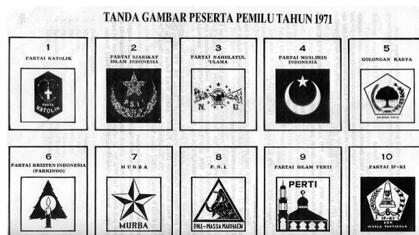
Gambar 1. Tanda Gambar Peserta Pemilu 1971