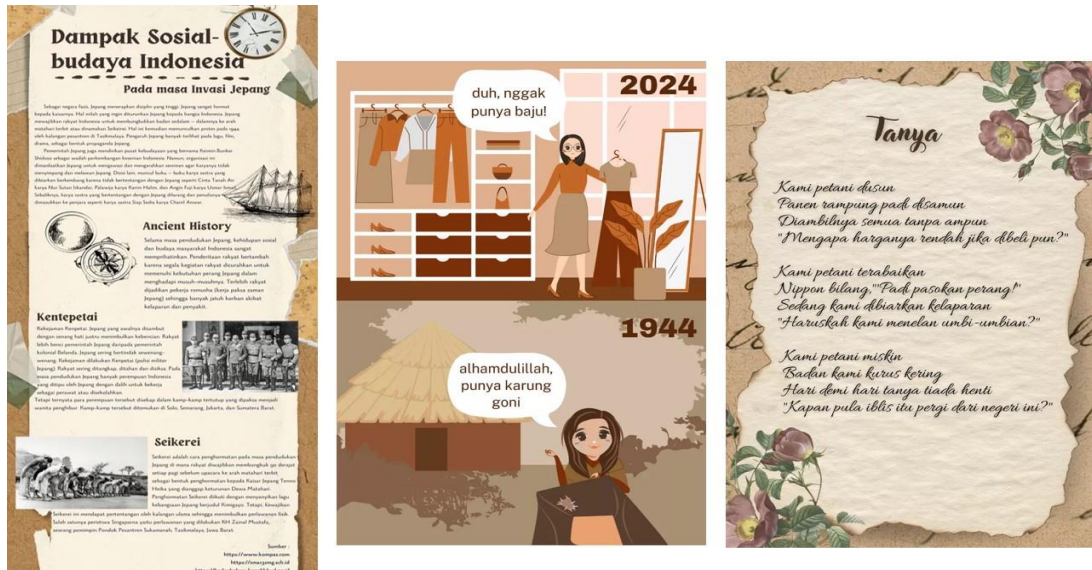
Gambar 2. Keragaman produk hasil karya peserta didik kelas XI-2

produk pembelajaran menggambarkan kemampuan peserta didik (lihat gambar 2 dan gambar 3).