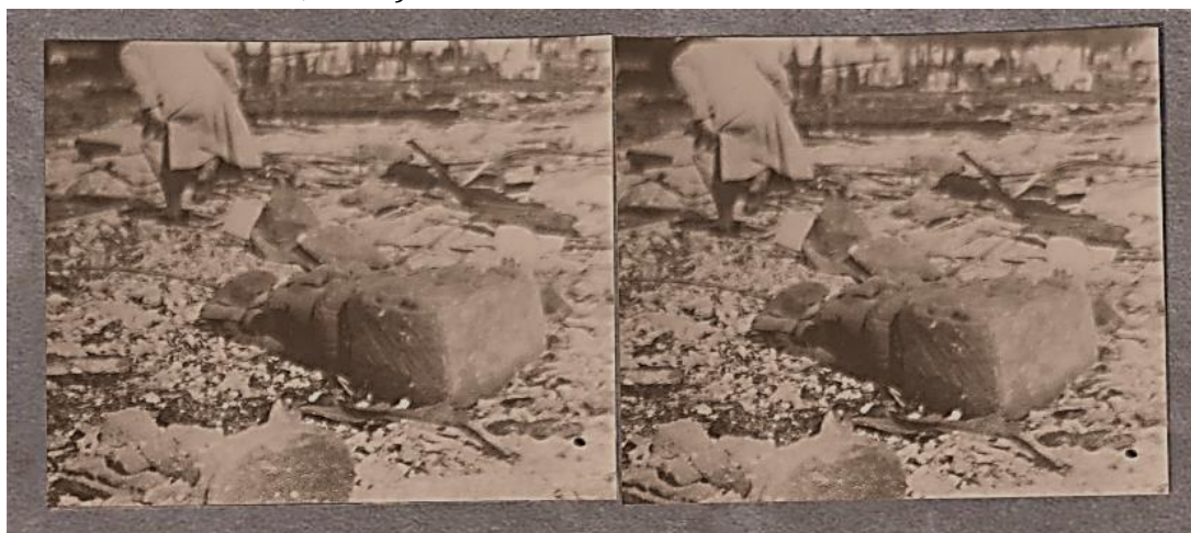
Gambar 2. Kondisi arca Ganesha dengan Gana (rebah) setelah terbakar dalam Pameran Kolonial Internasional di Paris, 1931

Menurut kesaksian T.R. Roorda, banyak koleksi KBG yang hancur terbakar, jadi sangat wajar jika disebut sebagai bencana nasional. Ia menyatakan bahwa hanya sedikit koleksi yang berhasil diselamatkan. Menurut pemantauannya di lapangan, hanya dua panel relief dari Trowulan, beberapa arca Majapahit, arca Ganesha dengan Gana, dua kepala arca Buddha Borobudur, arca Resi Agastya dari Singosari, jaladwara dari Jawa Timur, lima belas arca emas, tiga puluh arca perunggu, arca Buddha perunggu dari Kutai, dan arca Avalokitesvara perunggu yang berhasil diselamatkan (Nieuwe Rotterdamsche Courant, 1931).