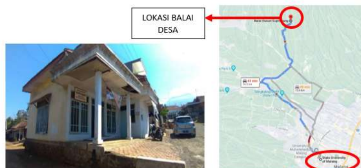
Gambar 1 Balai desa Supiturang

Desa Supiturang yang berada di wilayah kecamatan Karangploso, Kabupaten Malang, merupakan salah satu desa yang termasuk dalam desa di wilayah ini yang sedang berkembang. Kegiatan warga banyak dilakukan dan variatif sebagai usaha dalam memajukan kualitas desa, baik SDM maupun kesejahteraan. Balai desa Supiturang yang berada tidak jauh dari pintu gerbang sebagai batas desa, merupakan satu-satunya fasilitas warga yang digunakan dalam mewadahi semua kebutuhan aktivitas warga. Balai desa ini hanya terdiri dari dua ruangan yaitu satu ruang utama yang berukuran kurang lebih 8x7m 2 dan satu buah gudang yang letaknya berada di depan dan bisa diakses langsung dari luar. Di teras dan area ruang utama terdapat beberapa kerusakan seperti plafon yang lubang dan dinding yang kotor akibat bocor dan lembab.