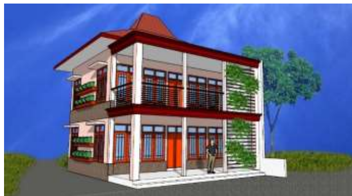
Gambar 7 Usulan desain gambar visualisai 3D

Bagian depan bangunan yang berbatasan langsung dengan jalan raya ditambahkan kisi-kisi dengan tanaman rambat (green wall) berfungsi sebagai pereduksi noise, polusi maupun radiasi matahari sebagai aplikasi aspek efisiensi energi bangunan. Bagian selatan bangunan (tampak samping) juga ditambahkan tanaman sebagai pereduksi radiasi panas matahari ke dalam bangunan. solar shading pada bagian selatan bangunan juga berfungsi sebagai pereduksi panas bangunan. pada bagian selatan, jumlah bukaan lebih sedikit dibandingkan di bagian depan sebagai respon untuk mengurangi radiasi panas matahari yang masuk ke dalam bangunan pada saat penyinaran di atas jam 12 siang. Visual 3D bangunan dapat dilihat pada