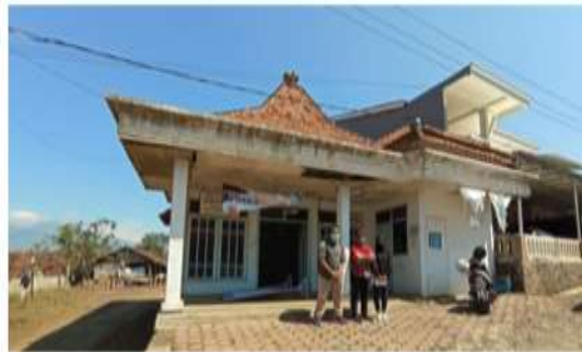
Gambar 2 Tim survey kegiatan pengabdian

Tahap kegiatan pengabdian masyarakat ini dimulai dengan melakukan diskusi dengan warga dan perangkat desa. Urgensi kebutuhan masyarakat desa untuk merenovasi secara keseluruhan bangunan menjadi latar belakang yang kuat untuk dilakukannya kegiatan ini. Setelah diskusi dengan warga, kemudian dilakukan pengukuran ulang untuk memperoleh data dimensi bangunan yang lebih valid yang akan digunakan pada tahapan perencanaan.