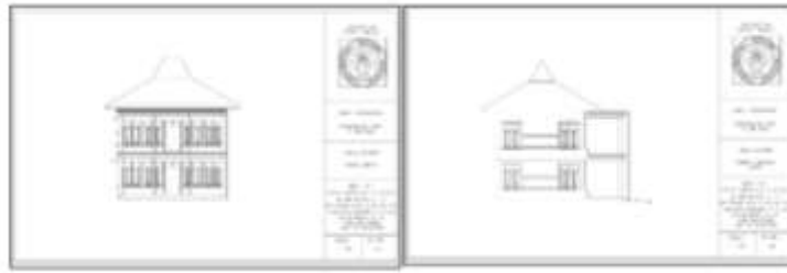
Gambar 6 Tampak usulan redesain (tampak depan dan tampak samping)

Re-desain balai desa dibagi menjadi 2 lantai dengan pembagian seperti yang ada di Error! Reference source not found. dan Error! Reference source not found. . Pada lantai 1 terdapat ruang baca, Gudang, ruang serbaguna, teras dan area parkir. Posisi Gudang sebagai area servis dipindahkan ke bagian belakang karena tidak memerlukan akses langsung terhadap pencahayaan dibandingkan dengan fungsi ruang lainnya. Pada lantai dua direncanakan untuk ruang-ruang fungsinya lebih private seperti kantor kepala desa, dan ruang rapat. Penempatan ruang-ruang private tersebut terkait tingkat kepentingan untuk fungsi masing-masing ruang. Dari aspek Kesehatan bangunan, penggunaan jendela sebagai sarana penghawaan atau ventilasi alami dimaksimalkan penggunaannya.