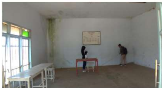
Gambar 3 Survey pengukuran ulang bangunan

Setelah data fisik obyek didapat maka tahap selanjutnya adalah koordinasi dengan tim pengabdian untuk melakukan analisis tapak dan zoning terlebih dahulu. Setelah hasil analisis