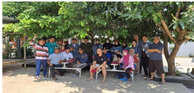
Gambar 2. Kegiatan Penilaian Kebersihan Bersama warga RW 10

Penilaian kebersihan ini meliputi beberapa indikator yaitu, kebersihan yang dimana mencakup bagaimana setiap lingkup RT mengelola sampah yang dihasilkan oleh tiap rumah, mempunyai sanitasi air yang baik, jalur pembuangan kotoran yang memadai. Selanjutnya kerapihan, yaitu bagaimana setiap lingkup RT dapat memberikan suasana lingkungan yang nyaman dan indah/asri. Yang terakhir adalah kreativitas, di mana setiap lingkup RT mampu memberikan hal unik yang mampu menarik minat banyak orang baik melalui seni, inovasi dan lain-lain.