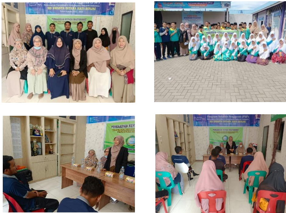
Gambar 2. Dokumentasi Pelaksanaan Tim PkM UINSU di SMP Istana Hati Binjai

Selama kegiatan pengabdian, tim PkM UINSU Medan juga mengabadikan kegiatan pelatihan dalam foto-foto berikut ini :