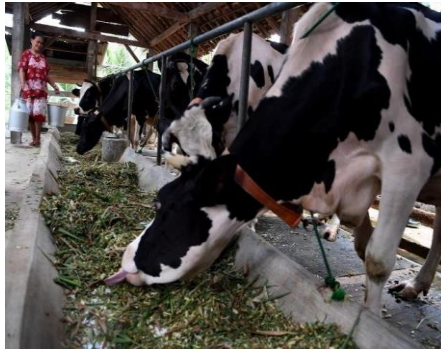
Gambar: Peternakan Sapi Perah Masyarakat Srigonco Bantur