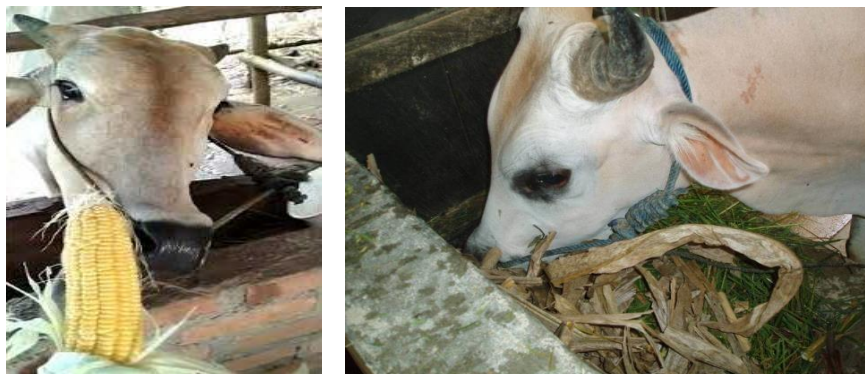
Gambar: Pencampuran Makanan Ternak Sapi Masyarakat Srigonco Bantur

Banyaknya masyarakat yang mengembangkan hewan ternak kambing dan sapi, desa srigonco dengan didukung letak geografis lahan perkebunan yang luas, memiliki potensi yang besar dalam menjalankan perekonomian masyarakat setempat. Pembuatan dan pencampuran pakan ternak merupakan hal yang utama untuk menghasilkan hewan ternak yang memiliki kualitas bagus. Komposisi pakan ternak untuk hewan pemeliharaan perlu memperhatikan gizi yang di perlukan hewan ternak. Pembuatan makanan ternak sapi dari berbagai macam komposisi diantaranya pollar, jagung, dedak padi, dll. Pembuatan komposisi ini dengan tujuan untuk menambah nutrisi makanan yang akan diberikan kepada hewan ternak sapi.