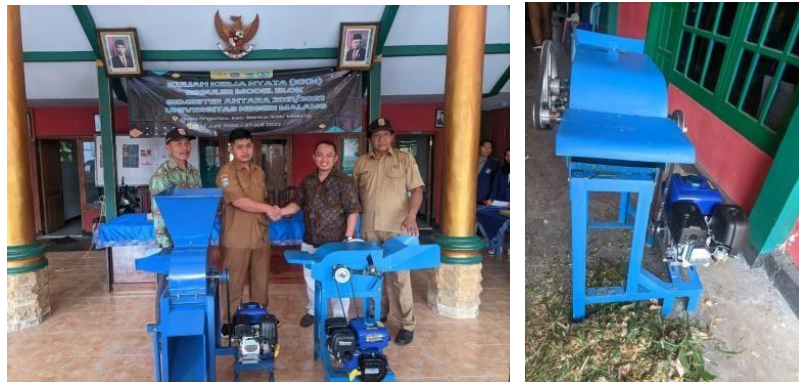
Gambar: Kegiatan Serah Terima Mesin Hummer Mill

Dengan penggunaan dan pemanfaatan mesin Hammer Mill bisa meningkatkan efektivitas dan efisiensi pada perternak didesa Srigonco. Kemudahan ini yang dapat mendorong masyarakat guna untuk meningkatkan produktivitas dalam kegiatan pengembangbiakan hewan ternak.