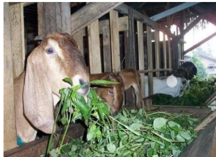
Gambar: Peternakan Kambing Masyarakat Srigonco Bantur

Banyaknya masyarakat yang mengembangkan hewan ternak kambing dan sapi, desa srigonco dengan didukung letak geografis lahan perkebunan yang luas, memiliki potensi yang besar dalam menjalankan perekonomian masyarakat setempat. Pembuatan dan pencampuran pakan ternak merupakan hal yang utama untuk menghasilkan hewan ternak yang memiliki kualitas bagus. Komposisi pakan ternak untuk hewan pemeliharaan perlu memperhatikan gizi yang di perlukan hewan ternak. Pembuatan makanan ternak sapi dari berbagai macam komposisi diantaranya pollar, jagung, dedak padi, dll. Pembuatan komposisi ini dengan tujuan untuk menambah nutrisi makanan yang akan diberikan kepada hewan ternak sapi.