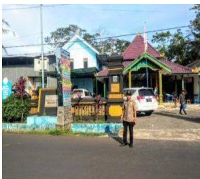
Gambar: Kantor Desa Srigonco, Bantur.

Desa Srigonco adalah sebuah desa yang subur dan asri yang terletak di Kecamatan Bantur, Kabupaten Malang, Jawa Timur. Desa Srigonco juga memiliki pantai sangat eksotis dan menarik wisatawan dari berbagai daerah bahkan wisatawan asing, pantai tersebut adalah Pantai Balekambang yang juga menjadi salah satu icon kota dingin Malang.