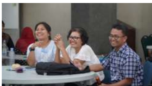
Gambar 7. Kegiatan kuis dan tanya jawab

Pendekatan interaktif yang digunakan, seperti sesi tanya jawab dan kuis berhadiah, meningkatkan keterlibatan peserta secara signifikan. Keterlibatan ini sejalan dengan temuan bahwa metode pembelajaran interaktif secara efektif meningkatkan pemahaman peserta hingga 40% lebih tinggi dibandingkan metode konvensional (Gulo et al., 2023). Dalam program ini, rata-rata skor pengetahuan peserta meningkat dari 45% sebelum pelatihan menjadi 85% setelahnya, menunjukkan peningkatan pemahaman yang jauh melampaui rata-rata peningkatan program sejenis di Indonesia.