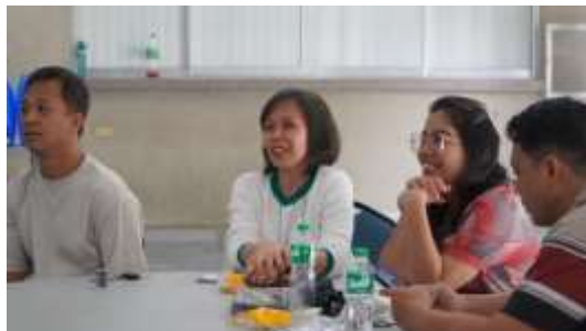
Gambar 5. Peserta mengikuti pemaparan seminar K3 dan HFE

Hasil evaluasi menunjukkan peningkatan signifikan dalam pemahaman peserta. Sebelum program, rata-rata skor kuesioner pengetahuan adalah 45%, dengan sebagian besar peserta belum memahami konsep ergonomi, pengelolaan risiko, dan pentingnya alat pelindung diri. Setelah program, rata-rata skor meningkat menjadi 85%, menunjukkan pemahaman yang jauh lebih baik terhadap materi yang disampaikan. Selain itu, 90% peserta menyatakan puas atau sangat puas dengan materi seminar, cara penyampaian narasumber, dan relevansi materi dengan kebutuhan mereka. Peserta juga memberikan masukan positif tentang interaktifnya sesi tanya jawab dan kebermanfaatannya kuis sebagai metode evaluasi.