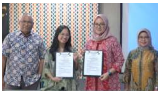
Gambar 2. Tandatanganan MoU Ketua Tim PKM (dua dari kanan) bersama ketua PPIF (dua dari kiri) dan Atdikbud (paling kanan) di AIIAS, Filipina