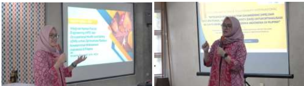
Gambar 4. Penyampaian materi seminar K3 dan HFE

Program ini dilaksanakan dalam bentuk seminar selama satu hari penuh di Adventist International Institute of Advanced Studies (AIIAS), Manila. Kegiatan dimulai dengan pembukaan oleh ketua tim PKM yang memperkenalkan tujuan program serta relevansi Human Factor Engineering (HFE) dan Keselamatan dan Kesehatan Kerja (K3) bagi mahasiswa teknik. Seminar inti berlangsung selama 90 menit, dengan materi mencakup konsep dasar HFE dan K3, penerapan praktis dalam lingkungan akademik, serta studi kasus yang relevan. Sesi ini diikuti oleh sesi tanya jawab selama 30 menit, dimana peserta aktif mengajukan pertanyaan terkait tantangan mereka dalam menerapkan prinsip keselamatan dan ergonomi. Sesi ini menghasilkan diskusi interaktif yang membantu peserta mendapatkan solusi praktis dari narasumber.