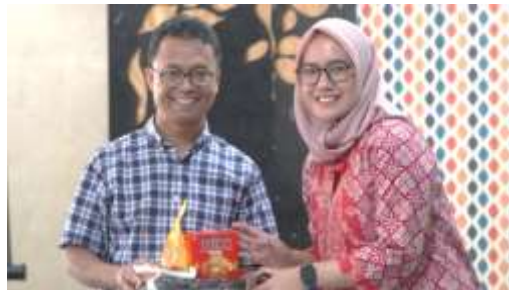
Gambar 3. Pemberian souvenir kepada peserta

Seminar luring dilaksanakan di Adventist International Institute of Advanced Studies (AIAS), Manila, dengan dihadiri mahasiswa Indonesia dari jenjang pendidikan S1 hingga S3, pengurus PPIF, dan perwakilan Kedutaan Besar Republik Indonesia (KBRI) di Filipina. Tim PKM, sebagai pakar Human Factor Engineering (HFE) dan Keselamatan dan Kesehatan Kerja (K3), memberikan paparan utama selama 90 menit. Materi yang disampaikan mencakup pengenalan konsep HFE dan K3, aplikasi nyata di dunia kerja, serta strategi penerapannya dalam konteks mahasiswa teknik, seperti penggunaan alat pelindung diri dan penataan lingkungan kerja yang ergonomis. Setelah itu, sesi tanya jawab interaktif berlangsung selama 30 menit, dimana peserta mengajukan pertanyaan terkait tantangan spesifik yang mereka hadapi, dengan solusi praktis yang dijelaskan langsung oleh pemateri. Untuk meningkatkan keterlibatan peserta, seminar diakhiri dengan kuis berhadiah berisi 5 pertanyaan berbasis materi seminar. Peserta dengan jawaban benar diberikan hadiah berupa souvenir menarik, voucher belanja, dan sertifikat partisipasi. Kegiatan ini diakhiri dengan foto bersama dan penyerahan cendera mata kepada perwakilan PPIF dan KBRI sebagai bentuk apresiasi atas dukungan mereka, sekaligus menghasilkan dokumentasi yang digunakan untuk publikasi program di media masa dan laporan resmi PKM.