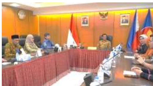
Gambar 1. Ketua Tim PKM (dua dari kiri) bersama DCM (tengah) dan Atdikbud (tiga dari kanan) di KBRI Manila, Filipina

Tahap persiapan program dimulai dengan survei kondisi mahasiswa teknik Indonesia di Filipina untuk menganalisis kebutuhan terkait Keselamatan dan Kesehatan Kerja (K3) dan Human Factor Engineering (HFE). Survei dilakukan secara daring melalui Google Forms untuk mengukur tingkat pengetahuan, praktik, dan tantangan mereka dalam keselamatan kerja. Hasilnya adalah laporan awal mengenai kebutuhan spesifik dan kesenjangan antara kondisi aktual dan ideal. Selanjutnya, konsolidasi dilakukan dengan Perhimpunan Pelajar Indonesia Filipina (PPIF) sebagai mitra strategis melalui pertemuan virtual melalui Zoom, penyusunan MoU, dan koordinasi dengan Kedutaan Besar Republik Indonesia (KBRI) di Filipina untuk mendukung legalitas program. PPIF berperan dalam menyediakan data, menyebarkan informasi, dan memfasilitasi kegiatan seminar dan workshop. Hasil konsolidasi berupa kesepakatan kerjasama, jadwal terstruktur, dan daftar peserta, memastikan program dirancang berbasis kebutuhan nyata mahasiswa dan didukung koordinasi dengan mitra lokal.