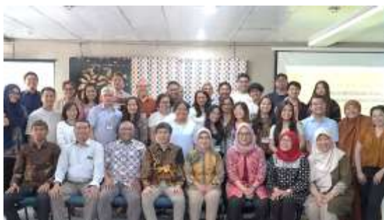
Gambar 8. Tim PKM dan Atdikbud beserta seluruh peserta seminar

Program ini memberikan dampak signifikan tidak hanya pada peserta tetapi juga pada pengembangan model pelatihan keselamatan yang dapat diadopsi secara lebih luas. Keberhasilan ini menegaskan pentingnya pendekatan HFE dan K3 berbasis lintas budaya sebagai strategi untuk menciptakan budaya keselamatan yang lebih adaptif dan berkelanjutan di lingkungan internasional.