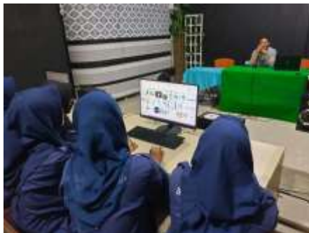
Gambar 3. Pemaparan materi pembuatan video bumper acara TV

sehingga memfasilitasi adopsi oleh peserta dengan berbagai tingkat keahlian teknis. Antusiasme peserta tercermin dari partisipasi aktif dalam sesi diskusi dan demonstrasi yang diselenggarakan.