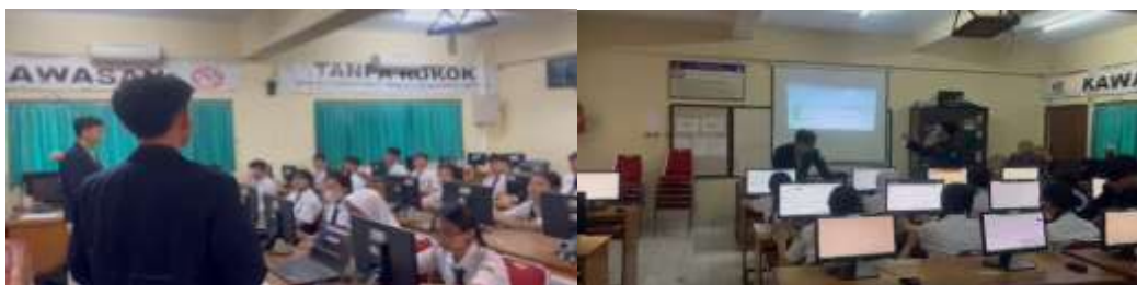
Gambar 1 Kegiatan Pelatihan

Kegiatan “Upaya Meningkatkan Personal Branding Dengan Pelatihan Pembuatan Website Portofolio di SMP (SLUB) Saraswati 1 Denpasar”, dilakukan dalam 1 sesi yang dilaksanakan pada tanggal 16 Desember 2024. siswa diberikan materi mengenai pengenalan tentang personal branding serta penjelasan apa itu website portofolio. Pada sesi awal, kami mengarahkan kepada siswa mengenai langkah langkah awal bagaimana cara mereka dapat menyunting sebuah template website yang telah di sediakan dan mengarahkan mereka untuk menyesuaikan dengan data diri seperti skill, prestasi maupun pencapaian yang telah mereka punya. Selama proses pembuatan website portofolio ini berjalan, para siswa wajib mengikuti serta memberikan hasil dari kerja keras mereka. Diakhir sesi kami memberikan materi berupa arahan untuk mengunggah kode website tersebut ke github, sehingga website yang telah dibuat tersebut dapat di lihat secara daring. Program pelatihan website personal branding ini dapat terlihat seperti pada gambar sebagai berikut :