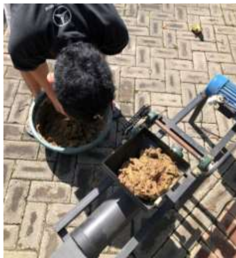
Gambar 3. Uji coba mesin pencetak batu bata bersama pengrajin di Desa Banjararum

Selain itu, kualitas bata lebih seragam dengan tingkat kerusakan (retak/patah) yang lebih rendah. Hal ini membuktikan bahwa mesin dapat menjawab kebutuhan mitra akan peningkatan kapasitas sekaligus mutu produksi. Proses uji coba ditunjukkan pada Gambar 3.