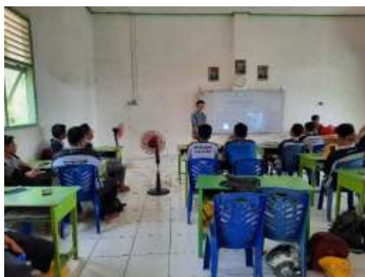
Gambar 2. Observasi Presentasi Awal

Pada hari kedua penulis memberikan pelatihan kepada para siswa dengan meminta perwakilan siswa untuk mencontohkan presentasi terlebih dahulu. Penulis menemukan cukup banyak tanda-tanda demam panggung.