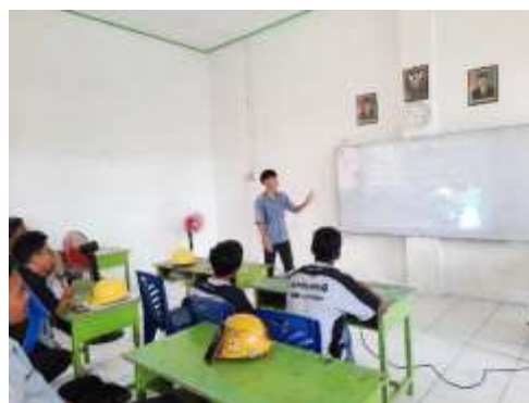
Gambar 8. Evaluasi Praktik Presentasi

Setelah semua materi tuntas disampaikan, penulis kembali meminta perwakilan siswa untuk melakukan presentasi ulang dengan materi yang sama. Siswa tersebut menyatakan bahwa dia menjadi lebih ringan dalam melakukan presentasi dan tidak segugup sebelumnya. Bahkan dia menjadi lebih berani dan percaya diri dalam memandang teman-temannya sebagai audiens dan berinteraksi dalam forum presentasi tersebut.