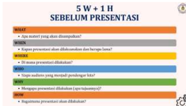
Gambar 6. Persiapan Presentasi

memiliki jam terbang yang cukup. Hal tersebut dikarenakan presenter belum menemukan trik dan teknik yang sesuai dalam mengatasi demam panggungnya.