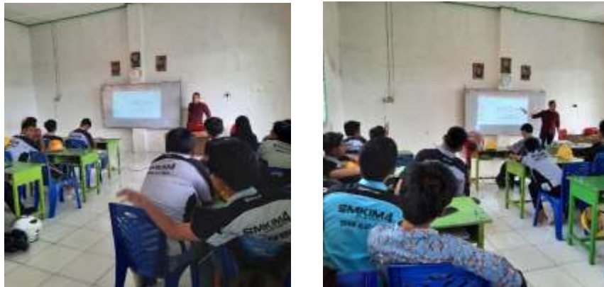
Gambar 4. Penyampaian Materi Pelatihan

Setelah materi tentang kiat powerpoint selesai disampaikan, penulis beralih ke materi tentang teknik presentasi yang baik dan benar.