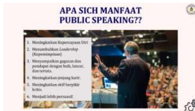
Gambar 5. Manfaat Public Speaking

Penulis menjelaskan tentang makna presentasi sebagai bagian dari public speaking, serta memaparkan manfaat apa yang akan diperoleh para siswa jika mempelajari dan menguasai presentasi sebagai bentuk public speaking.