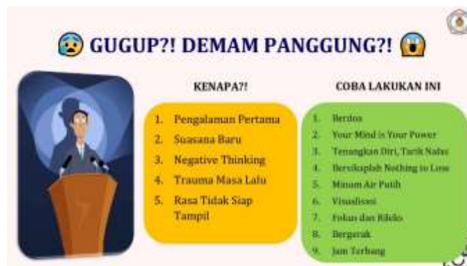
Gambar 7. Teknik Mengatasi Demam Panggung

Demam panggung berhubungan dengan kekuatan mental seseorang, sehingga tidak setiap teknik mengatasi demam panggung cocok antar satu orang dengan yang lainnya. Sehingga dalam mengatasi demam panggung, seseorang harus mengeksplorasi berbagai macam kiat dan menggabungkan kiat-kiat tersebut agar sesuai dengan kondisi mentalnya ketika berbicara di depan publik.