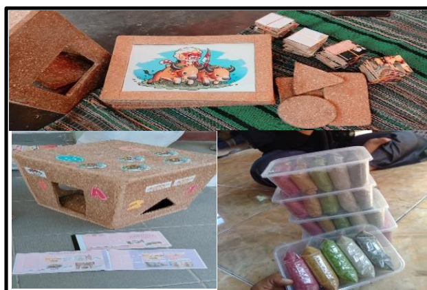
Gambar 2. APE Berkearifan Lokal Madura

dan dibantu dengan SOP yang disertakan dalam APE tersebut. Ketiga media ini merupakan media yang dinyatakan efektif digunakan untuk menstimulasi enam aspek perkembangan anak setelah dikaji pada subjek yaitu pendidik atau guru di lima lembaga PAUD di Bangkalam Madura. Enam aspek perkembangan anak terdiri dari perkembangan kognitif, perkembangan bahasa, perkembangan sosial emosional, perkembangan nilai agama moral, perkembangan motorik dan perkembangan seni. Berikut ini adalah gambar dari media pembelajaran bermuatan kearifan lokal Madura.