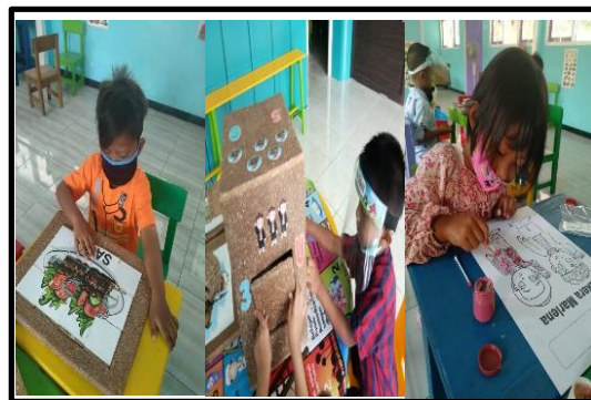
Gambar 3: Anak Memainkan APE

pembiasaan berdoa sebelum dan sesudah bermain yang masuk pda aspek nilai agama dan moral. Aspek bahasa dapat distimulasi dengan mengeja huruf dan berkomunikasi dengan guru atau teman sebaya saat bermain. Aspek kognitif yang banyak diperoleh dengan media kotak pintar dimana anak dapat belajar mengetahui bentuk-bentuk geometri, mengenal huruf dan angka, mengenal budaya daerahnya dan belajar menghitung gambar yang ada pada tepi kotak pintar. Aspek sosial emosional distimulasi dengan kemampuan anak untuk bermain bergantian dan sabar memasukkan bentuk geometri pada lubang yang sesuai. kemampuan tersebut juga masuk pada aspek motorik anak yang memasukkan potongan bentuk, mengangkat kotak, memutar dan membalikkan kotak. aspek seni sama dengan media yang lain yaitu distimulasi dengan melakukan bermain sambil bernyanyi dan menirukan gerak tari yang ada pada gambar kotak pintar tersebut. Hasil survei diperoleh hasil bahwa kotak pintar adalah APE yang paling kokoh namun juga memiliki kekurangan yaitu berat kotak yang untuk anak-anak usia dini perlu bantuan dari guru untuk memutar, membalik dan mengangkatnya. Berikut adalah gambar ketika anak memainkan puzzle, kotak pintar dan sergunani saat sekolah luring.