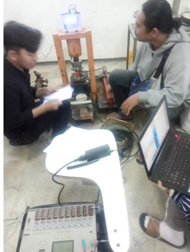
Gambar 17. Proses pengujian bahan uji untuk kalibrasi turunan Compression Testing Machines (CTM) dengan Load Cell dan Data logger .