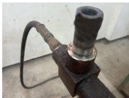
Gambar 6. Interface penghubung yang menempel Pipa Drat CTM ( Compression Testing Machines )

Pengecekan sedetil mungkin kesesuaian ukuran sock drat yang dibutuhkan untuk menghindari terjadinya kesalahan dan kerusakan alat