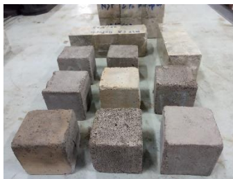
Gambar 13. Bahan uji untuk kalibrasi turunan mesin Compression Testing Machines (CTM) dan Universal Testing machine (UTM)

Langkah selanjutnya membuat pemodelan bahan uji sejumlah 30 pcs, dengan rincian 10 bahan uji dengan nilai ukur 25 kN, 10 bahan uji dengan nilai ukur 50 kN, 10 bahan uji dengan nilai ukur 75 kN.