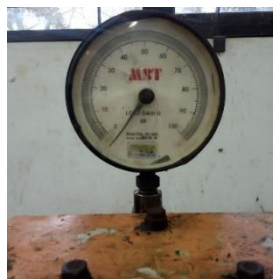
Gambar 3. Dial Gauge CTM ( Compression Testing Machines )

Menyesuaikan bentuk dan ukuran drat ulir pada alat dan pada Pressure Transmitter , sehingga sensor Pressure Transmitter bisa dihubungkan dengan jalur pipa olie hidraulik untuk memberi tekanan dan berfungsi sebagai pengukur pembacaan nilai hasil uji bahan yang ditekan.