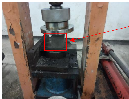
Proses pengujian untuk kalibrasi turunan