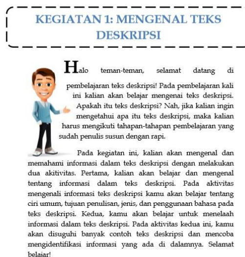
Gambar 2 Kegiatan dalam Bahan Ajar

Bahan ajar yang dikembangkan terdiri atas empat kegiatan. Kegiatan 1 merupakan unit yang menyajikan pengenalan awal dan pembangunan konteks teks deskripsi kepada siswa. Materi pada bagian ini merupakan materi pengenalan teks deskripsi berupa informasi-informasi yang terdapat dalam teks deskripsi. Kegiatan 2, merupakan tindak lanjut dari kegiatan 1. Pada kegiatan dua, disajikan latihan soal berdasarkan materi yang telah dipelajari pada kegiatan 1. Disajikan latihan dalam tabel dan kolom yang telah diberikan contoh pengerjaan sehingga siswa memahami cara mengerjakan soal. Kegiatan 3 adalah kegiatan yang menyajikan materi mengenai struktur dan kebahasaan teks deskripsi. Disajikan contoh teks yang telah diidentifikasi beserta ulasan materi mengenai struktur dan kebahasaan teks deskripsi. Kegiatan 4 merupakan kegiatan memproduksi teks deskripsi dan menyajikannya secara lisan.