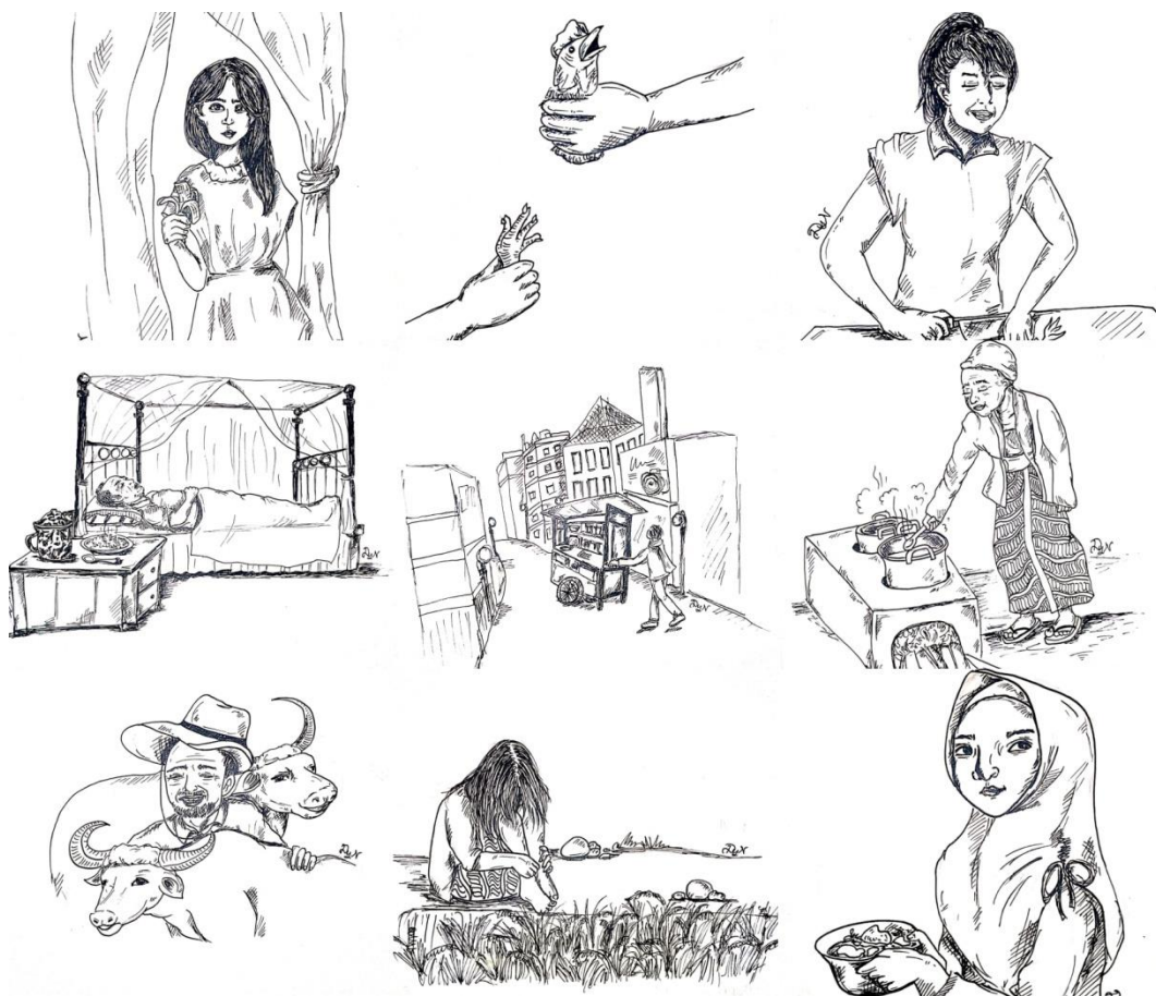
Gambar 2. Ilustrasi dalam Buku Terantai Mimpi Sengkala