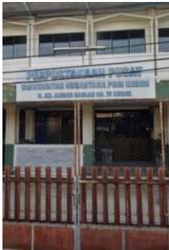
Gambar 1. Perpustakaan UNP Kediri

Berdasarkan gambar 1 merupakan gambar perpustakaan UNP Kediri. Perpustakaan UNP Kediri terlihat sangat bersih serta tempatnya yang strategis yaitu jauh dari keramaian.