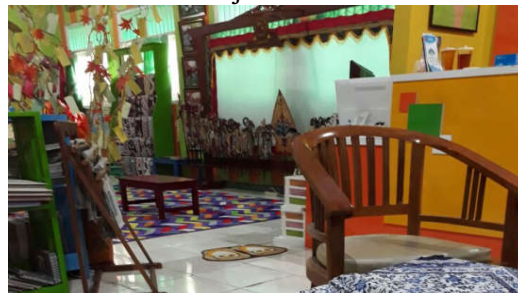
Display Wayang dan Batik (Dokumen Pribadi)

Display Wayang ini ditampilkan di ruang Perpustakaan. Wayang di display menggunakan kelir lengkap dengan lampu. Beberapa tokoh wayang seperti Pandawa dan Kurawa juga didisplay. Pustakawan juga membuat buku diskripsi tentang tokoh-tokoh wayang, seperti karakter dan sifat masing-masing tokoh wayang. Selain itu perpustakaan "HAMKA" mempunyai display batik khas Yogyakarta yang termasuk budaya lokal. Layanan ini bertujuan untuk mengenalkan kepada siswa budaya wayang Jawa dan batik, beserta karakternya yang dapat dicontoh maupun tidak oleh siswa.