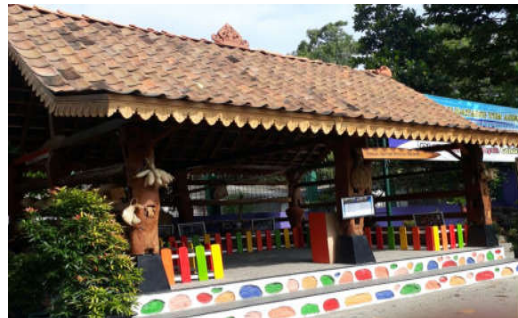
Rumah Literasi Budaya Agraris

Rumah Literasi Budaya Agraris ini merupakan layanan yang diberikan Perpustakaan "HAMKA" SD Muhammadiyah Condongcatur dalam mengenalkan budaya pertanian zaman dahulu. Konsep layanan ini dibuat menggunakan bekas kandang kerbau, yang diletakkan didepan pintu masuk sekolah. Layanan ini berisikan alat-alat pertanian tradisional Jawa, seperti luku, garu, lumpang dan alat rumah tangga seperti gentong, lesung, dll. Selain menampilkan beberapa alat pertanian layanan ini juga memuat buku-buku mengenai budaya-budaya zaman dahulu mengenai pertanian. Pembuatan Rumah Budaya Literasi Agraris ini, bertujuan untuk mengenalkan siswa tentang budaya pertanian masa lampau kepada siswa. Upaya ini dilakukan karena perpustakaan menyadari bahwa sekarang ini siswa tidak mengetahui budaya pertanian zaman dahulu.