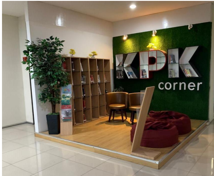
Gambar 1. KPK Corner di Telkom University Open Library

universitas pada kampanye yang dilakukan oleh Telkom University maka akan menambah citra baik pada masyarakat.