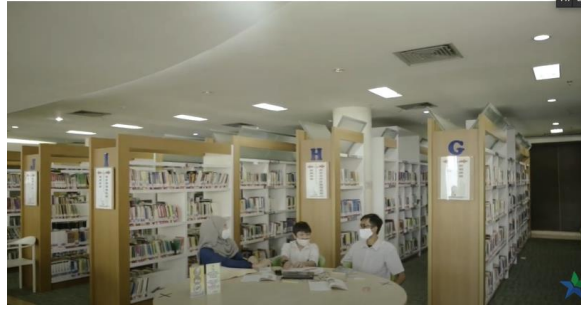
Gambar 10. Interior pada area koleksi

Berdasarkan adegan di atas dapat dilihat bahwa perpustakaan memiliki gedung yang cukup besar dengan ruangan-ruangan yang cukup luas. Pemilihan interior modern dengan tone warna warm yang didominasi warna coklat dan putih.