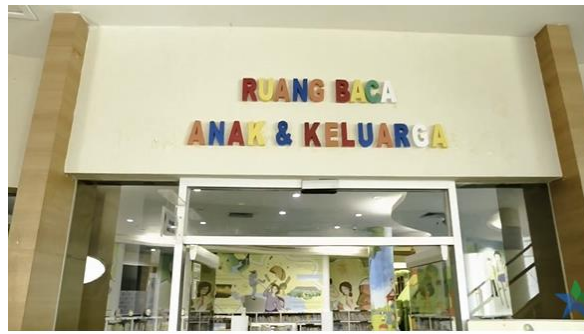
Gambar 4. Tampak depan ruang baca anak