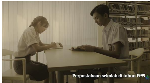
Gambar 7. Perpustakaan Sekolah

Pada adegan di atas dapat dilihat terdapat dua orang anak sekolah menengah atas yang sedang membaca buku di perpustakaan, pada gambar tersebut terdapat teks berupa keterangan tempat dan waktu yaitu “perpustakaan sekolah di tahun 1999”.