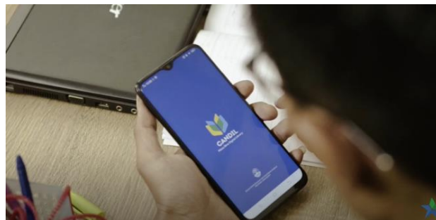
Gambar 8. Aplikasi digital perpustakaan

Gambar di atas memperlihatkan bagaimana penggunaan aplikasi perpustakaan digital yang menyediakan berbagai fitur yang dapat diakses melalui smartphone pengguna. Hal ini memungkinkan pengguna untuk dapat mengakses layanan dan koleksi digital perpustakaan secara online .