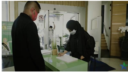
Gambar 1. Pemustaka mengisi buku pengunjung

Pada gambar di atas dapat dilihat bahwa pengunjung perpustakaan melakukan kegiatan menulis untuk mengisi daftar pengunjung perpustakaan. Kegiatan tersebut dilakukan secara manual dengan diawasi oleh petugas yang jika dilihat berdasarkan penampilannya adalah seorang satpam.