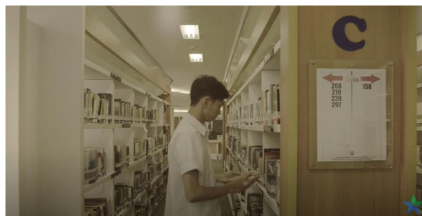
Gambar 6. Kode koleksi pada sisi rak

Gambar di atas menampilkan seseorang yang sedang mencari buku secara langsung di rak koleksi. Terdapat tanda berupa simbol huruf C di sisi rak dengan tanda panah beserta deretan angka berupa kode buku tanpa keterangan.