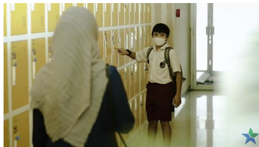
Gambar 2. Pemustaka menyimpan tas di loker