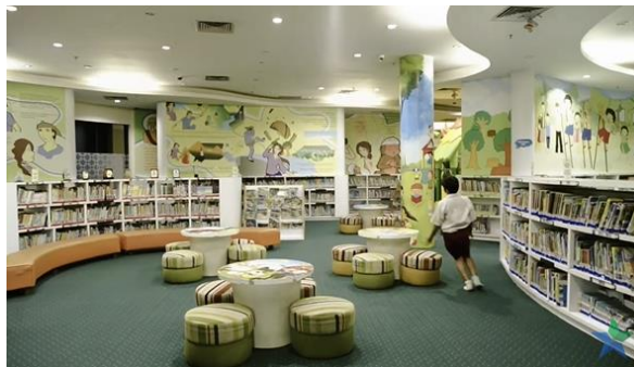
Gambar 5. Tampak dalam ruang baca anak

Berdasarkan gambar di atas dapat dilihat bahwa perpustakaan menyediakan ruang baca anak dan keluarga dengan tampilan yang penuh warna terang yang identik dengan anak-anak sehingga mudah untuk dikenali dengan dinding yang penuh dengan berbagai macam gambar animasi. Di dalam ruangan juga dapat dilihat rak buku dengan koleksi yang cukup banyak dengan fasilitas area baca berupa sofa dengan desain yang ramah anak.