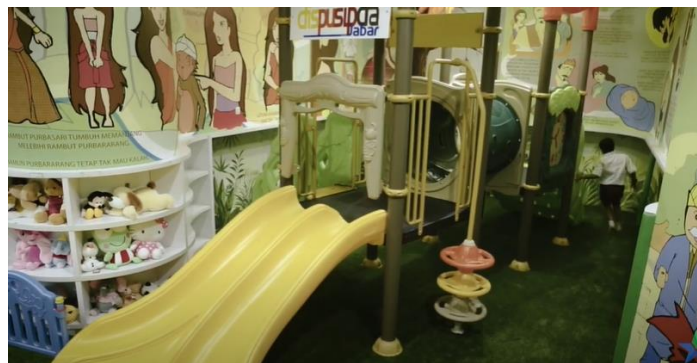
Gambar 11. Sarana bermain anak

Berdasarkan gambar di atas dapat dilihat bahwa terdapat berbagai permainan anak-anak seperti seluncuran, terowongan dan berbagai macam boneka yang tersedia di dalam ruang baca anak dan keluarga.