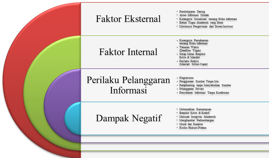
Gambar 2. Model Hubungan Antara Faktor-Faktor yang Mendorong Pelanggaran Etika Informasi

adalah kunci untuk membentuk generasi yang cerdas, berintegritas, dan bertanggung jawab.