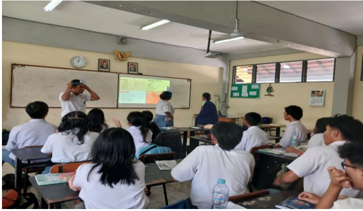
Gambar 3. Suasana Permainan Hedbanz

Kegiatan penutup menunjukkan bahwa kedua kelompok menyelesaikan permainan secara bersamaan dalam waktu yang telah ditentukan. Peneliti mengevaluasi pembelajaran hari itu dan menemukan bahwa peserta didik menunjukkan antusiasme yang sangat baik terhadap permainan Hedbanz , seperti yang tercermin dalam skor yang diperoleh. Pembelajaran menarik dan peserta didik fokus mengikuti sampai akhir sesi yang ditutup dengan perolehan skor. Peneliti melanjutkan pengasahan kosakata peserta didik dengan menggunakan aplikasi Wordwall , yang menampilkan kartu-kartu dengan gambar saja, tanpa artikel dan kosakata dalam bahasa Jerman, berbeda dengan permainan Hedbanz . Hal ini dibuktikan melalui pernyataan dua belas sampai lima belas yang diamati oleh kedua observer . Pernyataan kedua belas menyatakan, "Evaluasi hasil kelompok dilakukan bersama untuk merangsang refleksi dan pembelajaran bersama." Pada pernyataan ketiga belas dan keempat belas, disebutkan bahwa "Siswa dihadapkan pada tantangan dalam permainan Hedbanz yang meningkatkan motivasi dan semangat belajar," serta "Siswa merespons dengan positif terhadap elemen permainan seperti keberhasilan, tantangan, dan perolehan skor." Pernyataan terakhir atau kelima belas menyimpulkan bahwa "Permainan Hedbanz memberikan situasi pembelajaran yang menarik dan mempertahankan perhatian siswa."