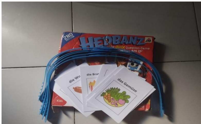
Gambar 1. Media Permainan Hedbanz

Pelaksanaan pembelajaran ini dilakukan secara offline atau tatap muka dalam satu kali pertemuan dengan akumulasi waktu tiga jam pelajaran (3x45 menit) di kelas XI.C dengan siswa berjumlah 20 orang di SMAK Frateran Malang. Selama pembelajaran, penulis dibantu oleh seorang teman sejawat untuk mengambil data observasi, sementara seorang guru bahasa Jerman berperan sebagai observer . Kegiatan dimulai dengan salam pembuka dan perkenalan diri, diikuti dengan penjelasan tujuan kehadiran kepada siswa serta doa. Materi pembelajaran tentang Essen und Trinken disampaikan menggunakan media presentasi Power Point (PPT), dengan memperkenalkan gambar-gambar makanan dan minuman kepada siswa. Guru mengajak siswa untuk membaca bersama kosakata terkait Essen und Trinken . Materi singkat yang disampaikan mencakup kosakata seperti das Essen (makanan), das Getränk (minuman), das Gemüse (sayuran), das Gericht (hidangan - fast food), das Obst/die Frucht (buah-buahan), dan jenis makanan lainnya. Setelah pemaparan materi, dilanjutkan dengan pengenalan permainan Hedbanz dan aturan main yang ditampilkan melalui Power Point (PPT).