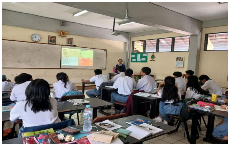
Gambar 2. Penyampaian Materi Essen und Trinken