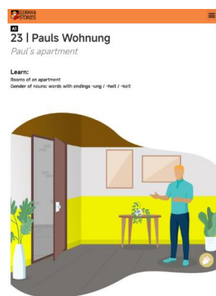
Gambar 1 Contoh Tampilan Podcast German-Stories.com

Bagian ketiga merupakan antarmuka dan navigasi. Bagian ini memiliki 8 kriteria yang hasil analisisnya akan peneliti uraikan sebagai berikut. Dari segi desain pada kelima episode podcast ini dirancang dengan jelas dan sederhana, sehingga memudahkan pengguna dalam mengakses materi. Dalam kelima episode podcast yang ada menampilkan multi bahasa untuk memudahkan pengguna memahami materi. Elemen visual yang digunakan pada kelima episode podcast ini berfungsi dengan baik dan mendukung interaksi pengguna dalam proses pembelajaran.