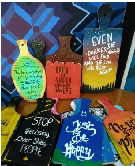
Gambar 2 Karya tugas akhir mata kuliah Tipografi Aplikatif yang berbasis proyek

Pembelajaran berbasis proyek ini juga mempertimbangkan kebermanfaatan karya yang dihasilkan. Sebagai contoh pada mata kuliah Tipografi Aplikatif, karya tugas akhir yang dibuat dalam bentuk produk yang dapat dipasarkan. Media pengaplikasian tipografi tidak lagi media konvensional pembelajaran tetapi diaplikasikan pada media-media yang dapat memberikan benefit atau dapat dipasarkan. Hal ini sesuai dengan visi program studi Desain Komunikasi Visual untuk membentuk jiwa kewirausahaan mahasiswanya. Berikut adalah contoh karya tugas Tipografi Aplikatif yang telah diimplementasikan pada media talenan yang saat ini sedang disukai masyarakat sebagai interior atau hiasan ruangan.