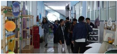
Gambar 4 Pameran juga memanfaatkan selasar untuk display karya

Talkshow diadakan berbarengan dengan apresiasi terhadap karya akhir mata kuliah Animasi 2D. Talkshow mengambil tema senada dengan apresiasi tersebut yaitu Seluk Beluk Dunia Industri Animasi.