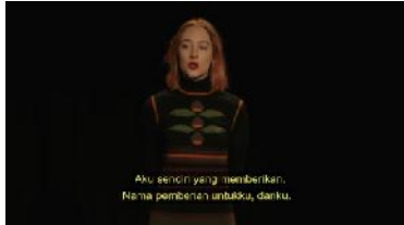
Gambar 1. Christine Memberi Nama Dirinya Sebagai Lady Bird

Pada film Lady Bird tokoh Christine sebagai remaja menciptakan dunia sinematik yang berpusat pada suara, ambisi, dan keinginannya. Christine mewarnai rambutnya dengan warna pink cerah dan memberi nama dirinya sebagai “Lady Bird”.