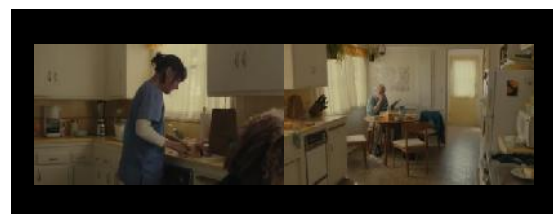
Gambar 4. Gambaran Ibu sebagai perawat dan Ayah sebagai pengangguran

Bahkan, bertentangan dengan male gaze , film ini menetapkan Christine sebagai perempuan aktif. Selain itu juga, peran ibu kandung Christine tampak sebagai perempuan aktif dibanding suaminya, sang ibu diceritakan sebagai perawat yang merupakan tulang punggung keluarga namun ia pun harus mengurus keluarga sedangkan suaminya seorang pengangguran.