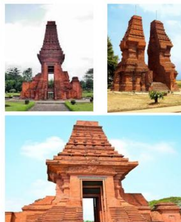
Image 4: (Up Right) Tikus Temple ; (Up Left) Wringin Lawang Temple ; (Below) Bajang Ratu Temple in Trowulan