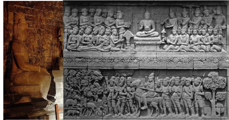
Image 1. Statue of Buddha Matriya on Mendut Temple.