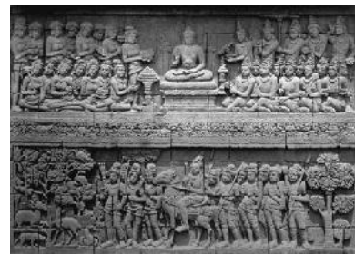
Image 2. Borobudur Temple Relief