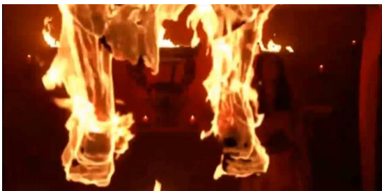
Gambar 10 Tubuh Jarwo yang Terbakar karena Pengaruh Kekuatan Jahat (00:46:36)