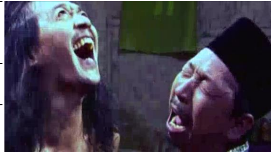
Gambar 3 Penggambaran Kuntet yang seperti Orang Gila (00:26:48)