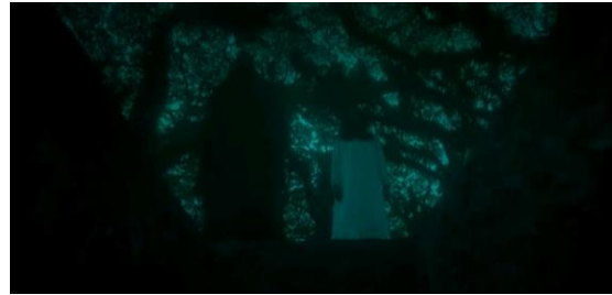
Gambar 12 Sri yang Terkena Efek Ilmu Hitam bersama Sosok Menakutkan (Setan) (01:29:11)

Sikap warga terhadap pelaku 'kafir' juga direpresentasikan dalam adegan penolakan warga saat mayat Jarwo akan dikuburkan di wilayah mereka (Gambar 13). Digambarkan warga berduyun-duyun menolak peti mati yang berisi mayat Jarwo masuk ke wilayah mereka, raut muka para warga digambarkan penuh kebencian.