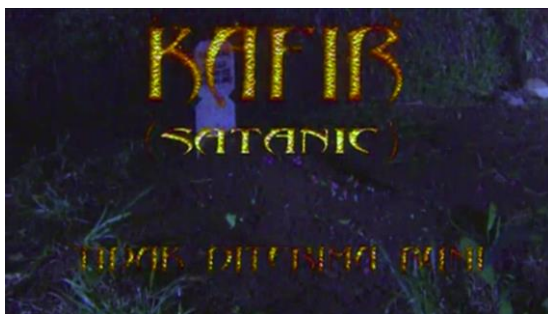
Gambar 2 Judul Menampilkan Teks 'Kafir' (Satanic) Tidak Diterima Bumi (00:00:33)

Dari awal film representasi 'kafir' dalam adegan sudah hadir secara eksplisit melalui teks Kafir (Satanic) Tidak Diterima Bumi yang menjadi judul dari film ini (Gambar 2).