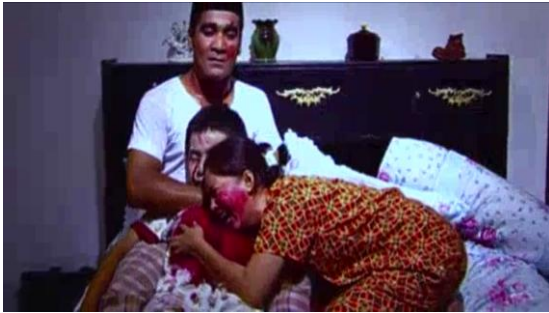
Gambar 7 Jodot Meninggal dengan Tragis (01:07:53)

Pada akhir film, Kuntet yang 'kafir' dan Suyahman yang tipis iman pada akhirnya mendapat hukuman berupa tersambar petir dan mati terbakar habis (Gambar 8). Digambarkan tubuh Kuntet benar-benar tidak diterima bumi seperti pernyataan pada awal film bahwa 'kafir' tidak diterima bumi. Membuktikan bahwa Kuntet memang benar-benar manusia 'kafir'.