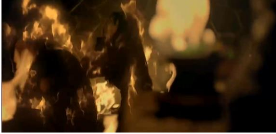
Gambar 15 Leila dan Hanum Ikut Terbakar setelah Jimatnya Dibakar (01:30:35)