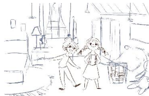
Gambar 3. Konsep Karakter

Tahap ketiga adalah proses praproduksi, pada tahap ini Bella Ansori menentukan konsep karakter yang akan dimasukkan dalam buku ilustrasi anak. Selain konsep karakter, latar belakang, dan color mood juga disusun sedemikian rupa agar terbentuknya landasan visual dalam berkarya. Dalam tahap ini proses sketsa juga dilakukan dengan menggunakan beberapa software ilustrasi dan desain seperti Adobe Photoshop , Adobe Illustrator , dan Easy Paint Tool SAI . Selain menggunakan software digital tersebut, ia juga menerapkan proses sketsa manual drawing pada proses kreatif perancangan buku ilustrasi anak.