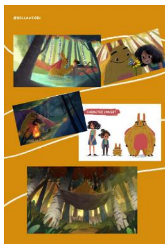
Gambar 6. Hasil karya Bella Ansori