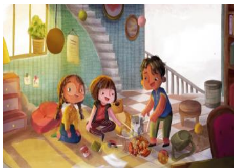
Gambar 5. Hasil karya Bella Ansori

Teknik yang menjadi acuan Bella Ansori dalam merancang karya buku ilustrasi anak adalah teknik digital painting dan digital drawing . Ia juga memiliki kiblat dalam gaya pengkaryaan. Disney style atau American style yang berpijak pada aliran surealisme dipilih Bella sebagai kiblat dari gaya pengkaryanya karena memiliki objek visual yang sederhana sehingga mudah diterima oleh mata pembaca. Karya-karya Bella Ansori juga dipengaruhi oleh gaya beberapa ilustrator seperti Beatrice Blue, Mr. Daniez, Salulu Art, Sarkodit, dan beberapa ilustrator dunia lainnya yang merujuk pada aliran surealisme.