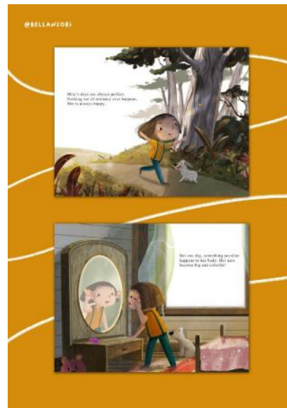
Gambar 7. Hasil karya Bella Ansori