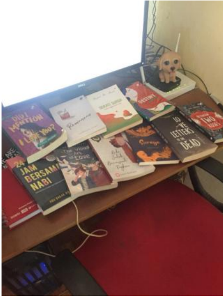
Gambar 2. Hasil karya Bella Ansori (Sumber: Bella, 2018)

dengan tayangan televisi dan media sosial yang dewasa ini kontennya mayoritas tidak layak untuk dikonsumsi oleh anak-anak. Selain itu, ia juga berharap dengan adanya karya-karya buku ilustrasi anak yang ia rancang, nantinya dapat berpengaruh positif pada masa kecil anak-anak minimal di lingkungan tempat tinggalnya.