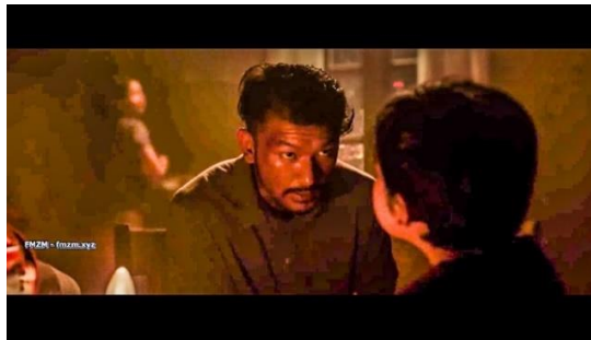
Gambar 6. Sancaka kecil ketika berdialog dengan ayahnya (00.03.37).

Pada adegan tersebut, Ayah Sancaka menemuinya dan berbicara tentang kemanusiaan. Sebagai seorang buruh pabrik yang teropresi, keluarga Sancaka mengetahui betul bahwa penindasan bukanlah bentuk kemanusiaan. Jika meninjau makna patriotis dengan tahap representasi, maka terdapat makna yang terkandung melalui kode-kode dialog. Ayah Sancaka mengatakan, “Kalau orang lain tidak mau memperjuangkan keadilan, bukan berarti kita harus begitu juga, kan? Karena, kalau kita diam saja melihat ketidakadilan di depan mata kita, itu tandanya kita bukan manusia lagi.” (Gambar 6). Dengan demikian, hasil yang diperoleh melalui kode dialog tersebut adalah bahwa ketidakadilan bukanlah sifat manusia, sehingga manusia haruslah menjunjung tinggi keadilan dan kemanusiaan.