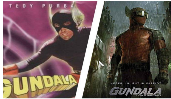
Gambar 4. Poster film Gundala 1981 & 2019.

Dengan demikian, baik film Gundala 1981 dan 2019 keduanya memiliki kepedulian terhadap isu-isu sosial. Dalam film pertamanya, kepedulian Gundala dalam mencegah Gazul dan kelompoknya membuktikan bahwa seorang superhero pun memiliki misi yang sama dalam menciptakan kehidupan bebas narkoba. Sedangkan, pada film kedua jiwa patriotisme yang terkandung dalam diri Gundala mencerminkan bahwa sikap rela berkorban haruslah dimiliki oleh siapa pun. Oleh karenanya, kepentingan dan kemajuan bangsa haruslah dijaga.