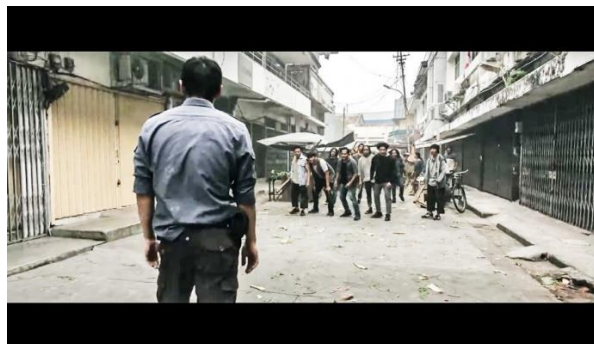
Gambar 10. Sancaka melawan preman.

Selanjutnya, pada tahap representasi, kode-kode kamera bergitu dominan. Adegan memperlihatkan Sancaka dengan berani melawan preman. Teknik pengambilan gambar secara one shot dan long shot (Gambar 10). Hal tersebut bertujuan menunjukkan secara jelas bahwa Sancaka dengan berani melawan preman-preman. Dengan demikian, pada tahap ideologi menunjukkan bahwa sikap berani dan rela berkorban haruslah ditanamkan. Sehingga, segala bentuk ketertindasan dapat dilawan apapun risikonya.