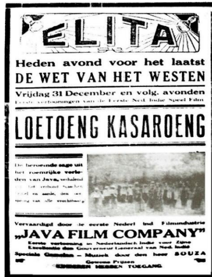
Gambar 2. Poster film Loetoeng Kasaroeng 1926.