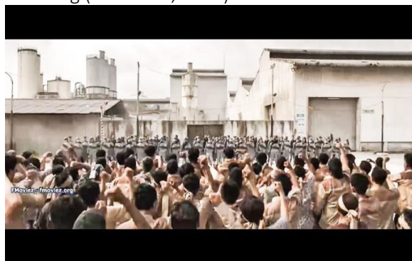
Gambar 5. Adegan pembuka film Gundala (00.000.56) yang melibatkan banyak pemeran.