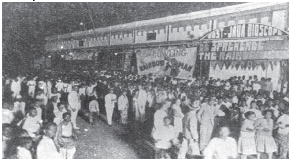
Gambar 1. Pemutaran Film Perdana di Hindia-Belanda.