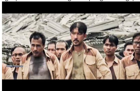
Gambar 7. Ayah Sancaka dalam menghadapi opresi pihak pabrik.

Sementara itu, pada tahap realitas sikap perjuangan dalam mencapai nilai keadilan dan kemanusiaan tercermin dalam kode-kode ekspresi dan latar tempat. Adegan bermula ketika ayah Sancaka untuk kedua kalinya melakukan demonstrasi ke pabrik. Dengan ekspresi yang kesal dan menggebu-gebu, menunjukkan bahwa terdapat sikap serius untuk mewujudkan keadilan bagi kaum buruh (Gambar 7). Kemudian, dari analisis tahap ideologi menunjukkan beberapa kode-kode ideologi, yakni ideologi semangat juang dalam menjunjung tinggi keadilan dan kemanusiaan. Sebab, ideologi dengan kekuatan positif yang diproduksi akan sangat berpengaruh bagi pengikutnya (Althusser, 2014).