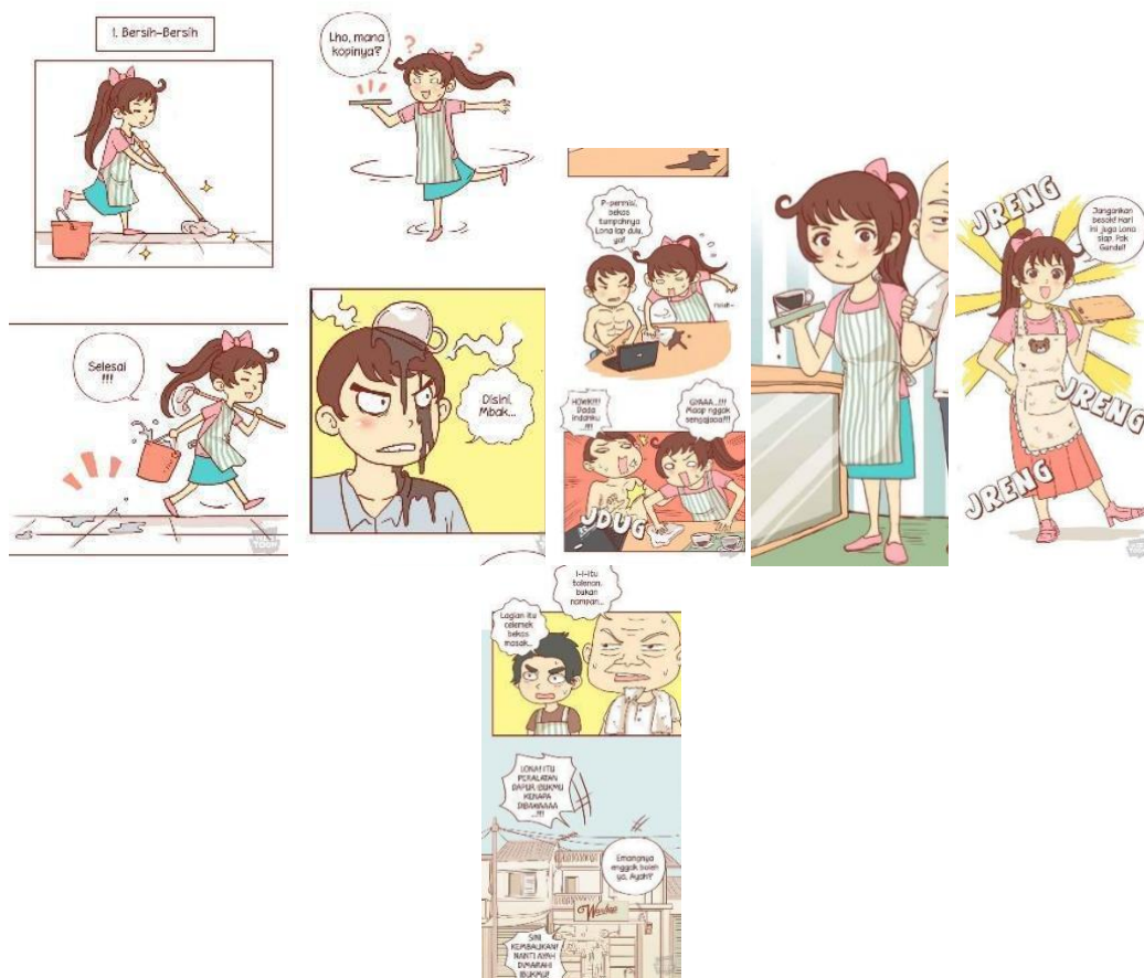
Gambar 8. Alona dan segala kecerobohnya

Alona memiliki penampilan sederhana dengan badan yang tinggi ramping dengan rambut merah yang lebih sering diikat saat sedang bekerja. Selama 950 episode, Alona hanya pernah memiliki 2 macam gaya rambut (diikat dan di gerai). Alona biasanya memakai baju berwarna merah muda dengan rok berwarna tosca. Salah satu yang menarik dari penampilan Alona adalah ahoge alias rambut poni yang melengkung dan cukup ikonik di atas kepalanya.