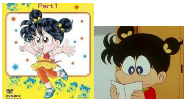
Gambar 9. Asari dalam series Asari-chan

diragukan karena di dalam manganya rambut yang menjuntai bukan cuma satu atau dua saja. Oleh karena itu, gaya rambut pada Asari ini dikatakan sebagai prototipe dari rambut ahoge yang asli.