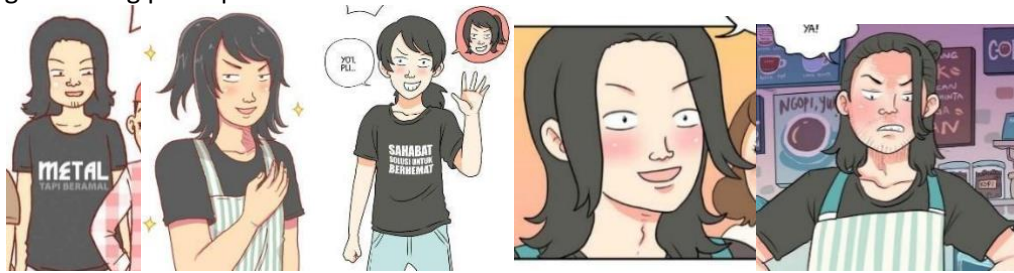
Gambar 2. Eko Episode 53, 163, 346, 595 dan Episode 910