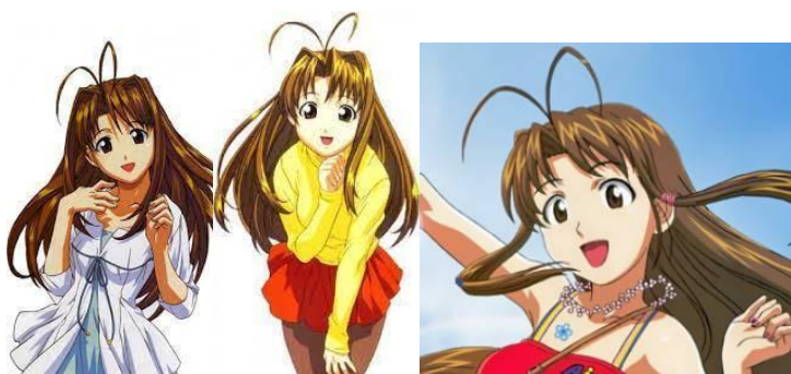
Gambar 10 Narusegawa Naru dalam series Love Hina

Sementara itu, untuk rambut ahoge yang asli diperkirakan mulai muncul pada karakter bernama Naru dalam series Love Hina. Series Love Hina sendiri tayang pada tahun 1998. Naru benar-benar memiliki dua buah helai rambut tipis yang menjuntai di atas kepalanya.