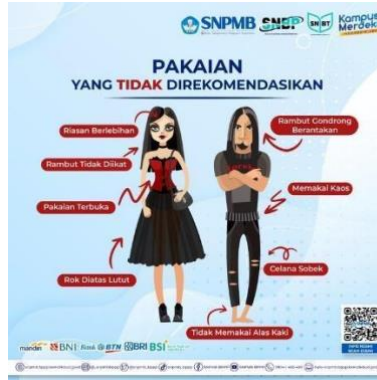
Gambar 6. Peraturan peserta SNPMB