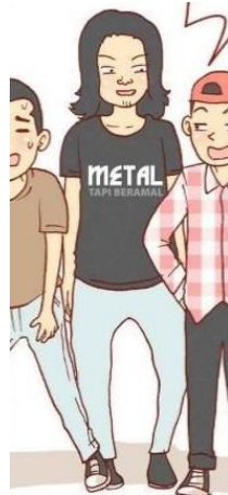
Gambar 4. Tampilan keseluruhan Eko