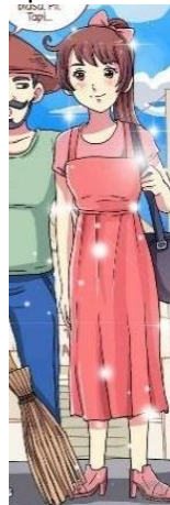
Gambar 7. Tampilan keseluruhan Alona

Sebagai sebuah tanda, desain dari karakter Alona juga bisa kita teliti dengan menggunakan teori semiotika Roland Barthes. Penelitian ini meliputi makna denotasi, konotasi, dan juga mitos yang ada pada visual.