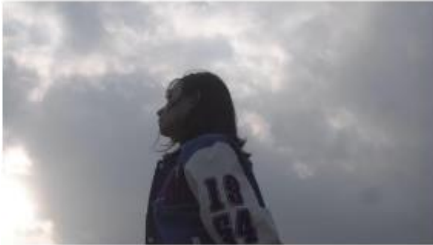
Gambar 12. footage video

Musik: lirik “I know it's hard for me, But I'm going to keep trying” Mendung yang menggambarkan suasana hati manusia yang sedang dalam kesulitan.