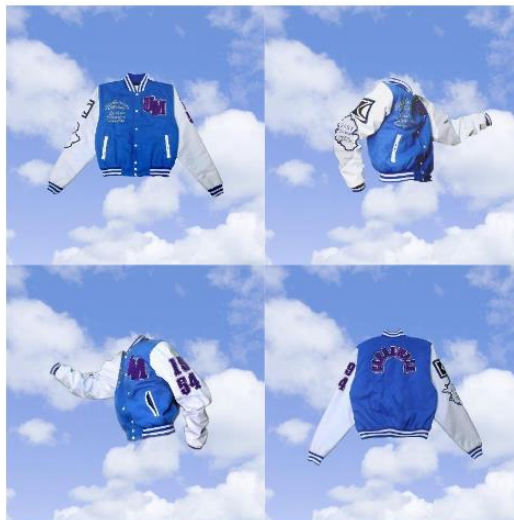
Gambar 7. Desain jaket dari visori.labs

Pada tanggal 25 Juli 2022, dilakukan studi dokumen yang melibatkan visori.labs. Studio ini didirikan pada awal tahun 2021 dan memiliki fokus tertentu kepada pembuatan merchandise universitas negeri malang. Pendiri visori.labs menyatakan yang membedakan dengan merchandise yang sudah ada adalah visori ingin membuat sebuah merchandise yang tidak memberikan kesan formal sehingga dapat digunakan sehari hari oleh mahasiswa yang disini selaku target audience utama dari visori.labs. Produk merchandise yang dibuat oleh visori yaitu berupa jaket varsity didesain menggunakan desain yang kasual namun masih menggunakan ornamen yang menunjukkan identitas serta ciri khas dari universitas negeri malang, seperti pemilihan warna, pembuatan asset desain, hingga slogan slogan yang mewakili universitas Negeri Malang.