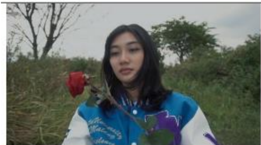
Gambar 11. footage video

Placement: Menampilkan produk varsity secara jelas dengan menampilkan logo visori. Dalam tahap ini mulai memperlihatkan logo tujuannya agar penonton menyadari placement dari visori itu sendiri. dipilih pada saat ini adalah memiliki tujuan yaitu tepat pada lirik yang cukup menjadi kunci lagu jadi penempatan ini disesuaikan dengan bagian penting dari video.