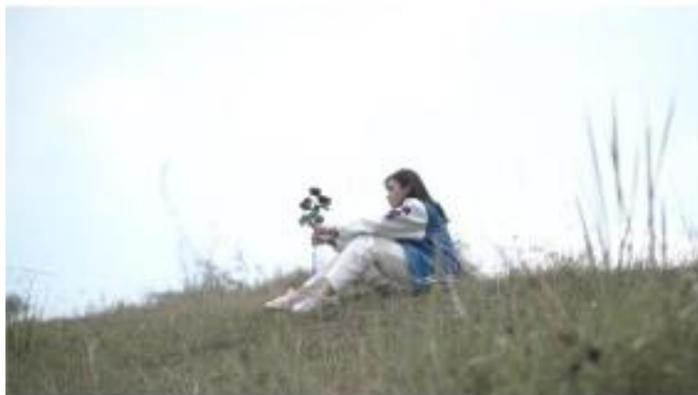
Gambar 9. footage video

Placement: menunjukkan produk varsity namun masih diblur dengan tujuan agar memberikan kesan spoiler pada penonton agar melanjutkan ke scene yang selanjutnya jika ingin melihat produk secara jelas.