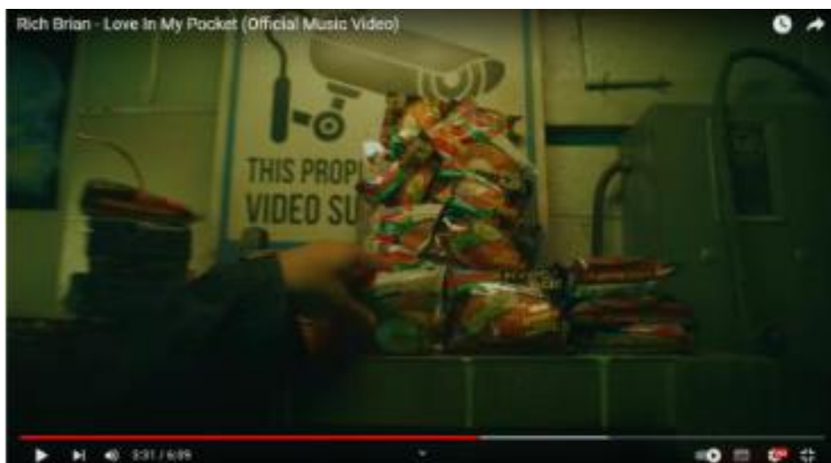
Gambar 1. video klip rich brian - love in my pocket (Susser 2020)