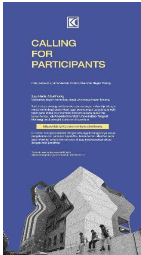
Gambar 3. poster observasi tidak langsung

Observasi tidak langsung yang dilaksanakan pada 25 juli 2022 dengan target audience Mahasiswa/alumni/staf UM yaitu selaku target konsumen dari Visori. Observasi tidak langsung ini dilakukan untuk mendapatkan beberapa informasi terkait selera konsumen serta mendapatkan penguat landasan penelitian video klip untuk media komunikasi brand visori ini.