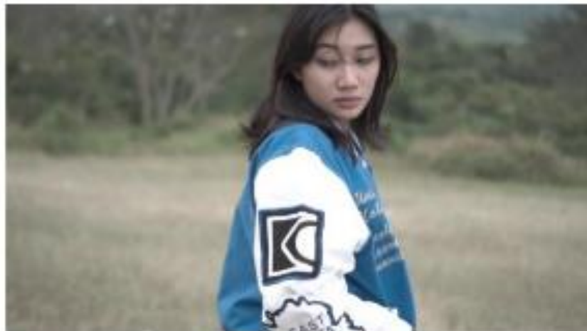
Gambar 10. footage video

Musik: lirik “Wishing you came back it won't happen”