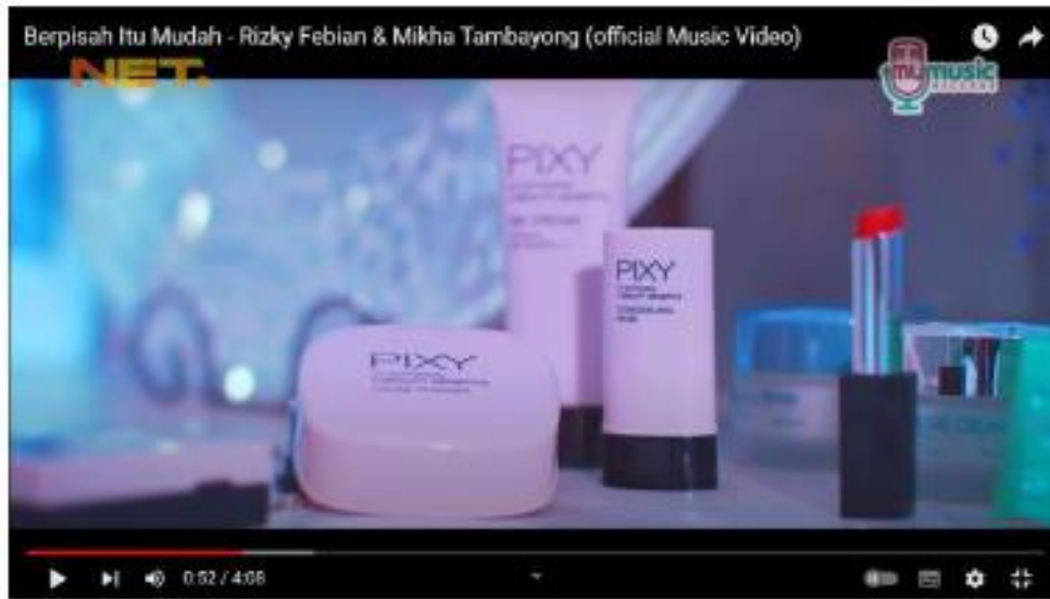
Gambar 2. video klip risky febian & mikha tambayong- berpisah itu mudah (Indra Sakti 2018)