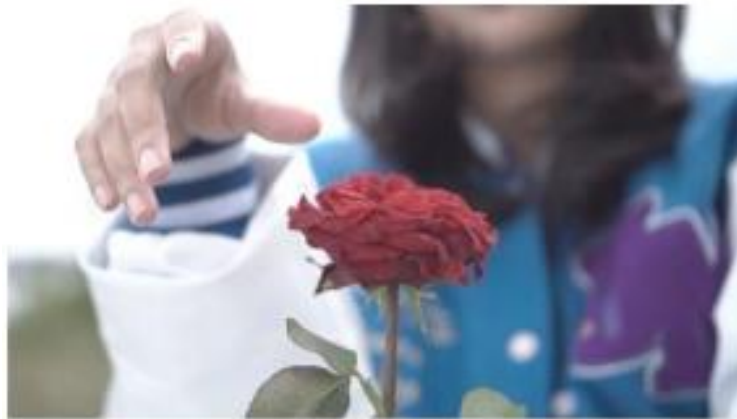
Gambar 8. footage video

Musik: lirik “During the day I feel bored”