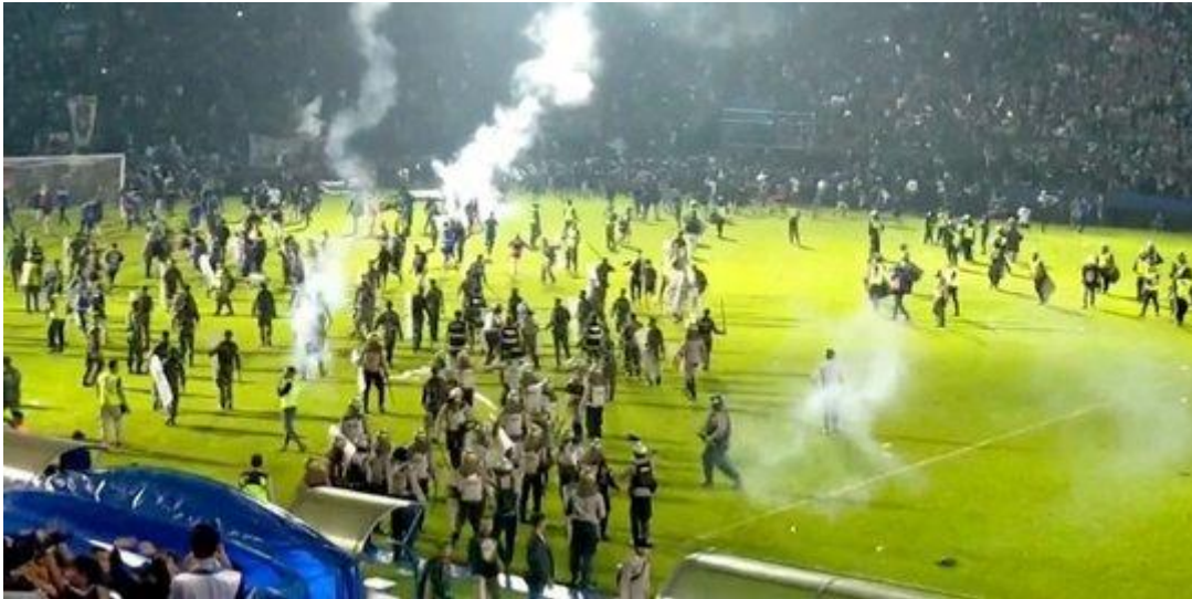
Gambar 1 : Kerusakan pada tragedi Kanjuruhan