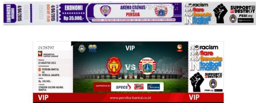
Gambar 5 Desain Tiket