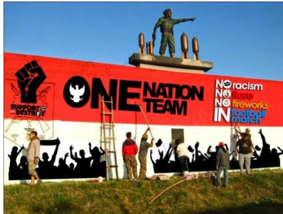
Gambar 10 Contoh desain Mural