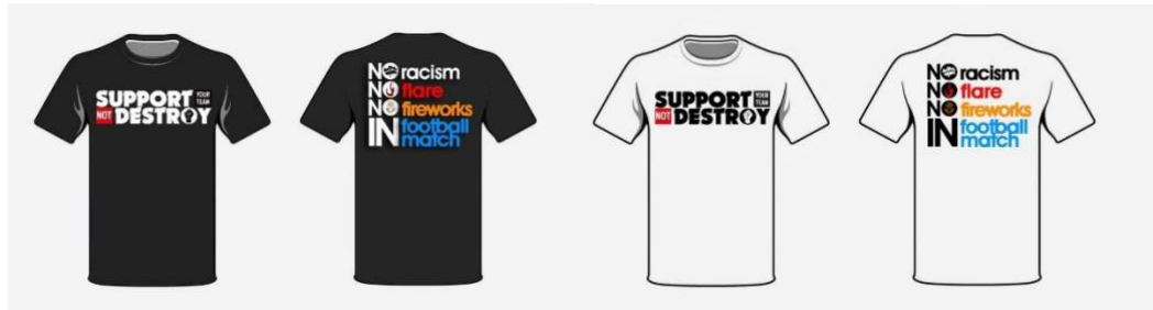
Gambar 8 Desain Kaos