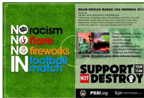
Gambar 4 Desain Flyer