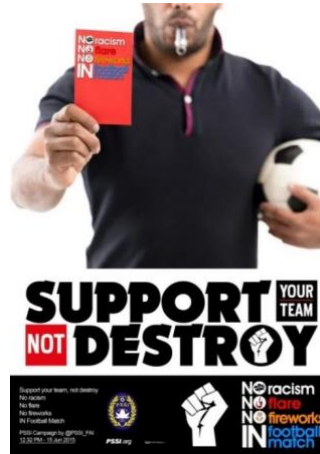
Gambar 3 Desain Poster