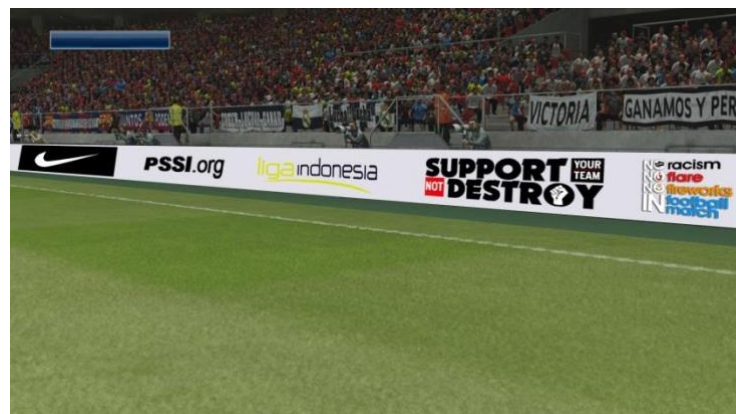
Gambar 9 Desain Ad Board