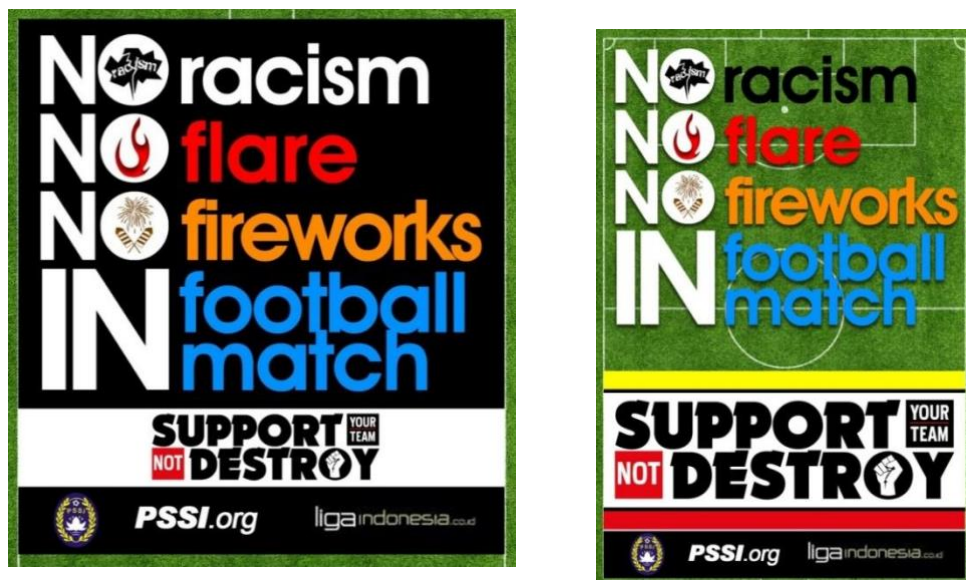
Gambar 7 Desain Stiker