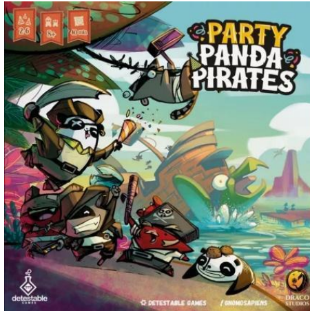
Gambar 3. Ilustrasi Kemasan Depan Party Panda Pirates