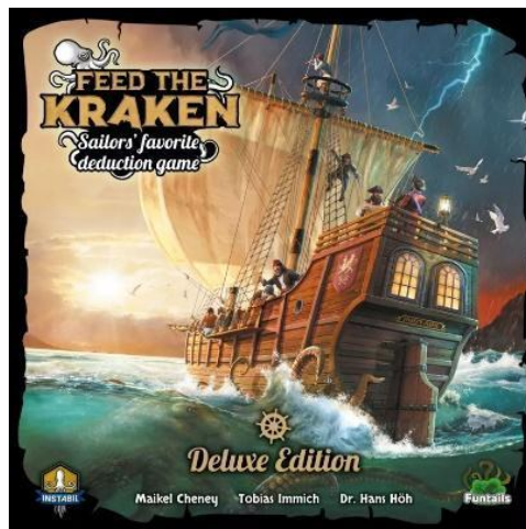
Gambar 1. Ilustrasi Kemasan Depan Feed the Kraken Deluxe Edition

Board game berjudul Feed the Kraken Deluxe Edition dirilis pada tahun 2022 dan ilustrasinya didesain oleh James Churchill dan Hendrik Noack. Board game ini menggunakan kemasan jenis telescoping box . Desain pada kemasan depan menggunakan gaya ilustrasi realis dengan tone warna yang mengarah ke warm tone . Elemen yang terdapat pada ilustrasi selain logotype , logo penerbit, ikon, dan teks informasi adalah beberapa bajak laut, burung, kapal, dan latar lautan.