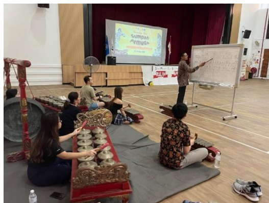
Gambar 3. Pelatihan Karawitan di Sekolah Singapura Indonesia (SIS) Sumber: Dok. Penulis

Selain memberikan lokakarya tari, tim pengabdian juga memberikan lokakarya gamelan yang tidak hanya dihadiri oleh beberapa peserta didik dan guru dari Sekolah Indonesia Singapura, namun juga mitra sekolah yakni dari beberapa mahasiswa Universitas Negeri Jakarta yang sedang melaksanakan program mengajar ke Luar Negeri di Singapura. Gamelan merupakan salah satu musik pendukung dalam pelaksanaan tari tradisional yang ditampilkan oleh tim pengabdian oleh karena itu, untuk memberikan pengajaran dalam bentuk praktik langsung menjadi penting (Mukti Azhar, et. Al, 2023) dalam tindakan promosi budaya sebagai tujuan utama kegiatan pengabdian ini.