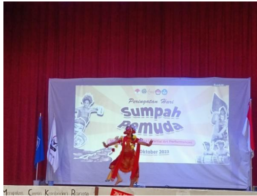
Gambar 2. Pertunjukan Tari Grebeg Sabrang di Sekolah Singapura Indonesia (SIS) dalam peringatan Sumpah Merdeka

Wayang topeng adegan Grebeg menggambarkan barisan prajurit yang berangkat menunaikan titah sang raja, mereka keluar dari Paseban menuju alun-alun. Selaras dengan pernyataan tersebut, Nirwana (2015) menjelaskan bahwa kesenian wayang topeng Malang memang acap kali menggambarkan pertunjukan drama tari yang menceritakan sosok manusia utuh dengan contoh keteladanan setinggi-tingginya dalam menjalani kehidupan, dikenal dengan sebutan nuladha laku utama . Maka disimpulkan bahwa secara tidak langsung, penampilan pagelaran bertajuk Topeng Malang di lingkungan pendidikan, Sekolah Indonesia Singapura, bisa mempengaruhi perilaku audience secara kolektif dengan nilai-nilai dalam tari yang ditawarkan.