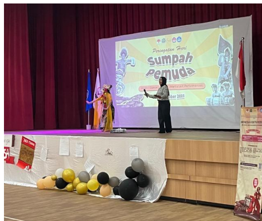
Gambar 1. Pertunjukan Tari Sekarsari dengan kolaborasi Puisi yang relevan di Sekolah Singapura Indonesia (SIS) dalam peringatan Sumpah Merdeka

Dalam keputusan pelaksanaan yang bertepatan dengan Hari Sumpah Pemuda, konten promosi yang akan diberikan tidak hanya berupa lokakarya namun juga penampilan. Dalam teori pengajaran bahwa demonstrasi merupakan salah satu cara termudah untuk memberikan pembelajaran yang bermakna. Sehingga sebelum pelaksanaan lokakarya, tim pengabdian merangkai sebuah ensemble pertunjukan yang bisa dinikmati sekaligus dipraktikkan nantinya dalam lokakarya.